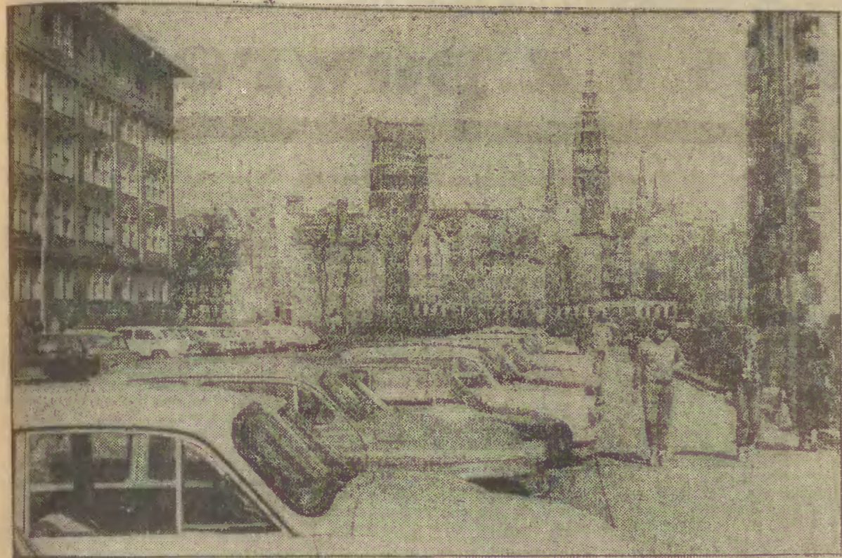
Główne Miasto widziane z ul. Zabi Kruk.