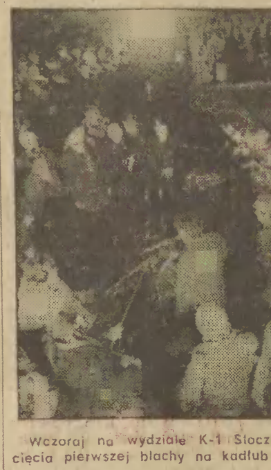
Wczoraj na wycięciu K-1 Stoczni Gdańskiej miało miejsce uroczyste cięcie pierwszej blachy na kadłub...