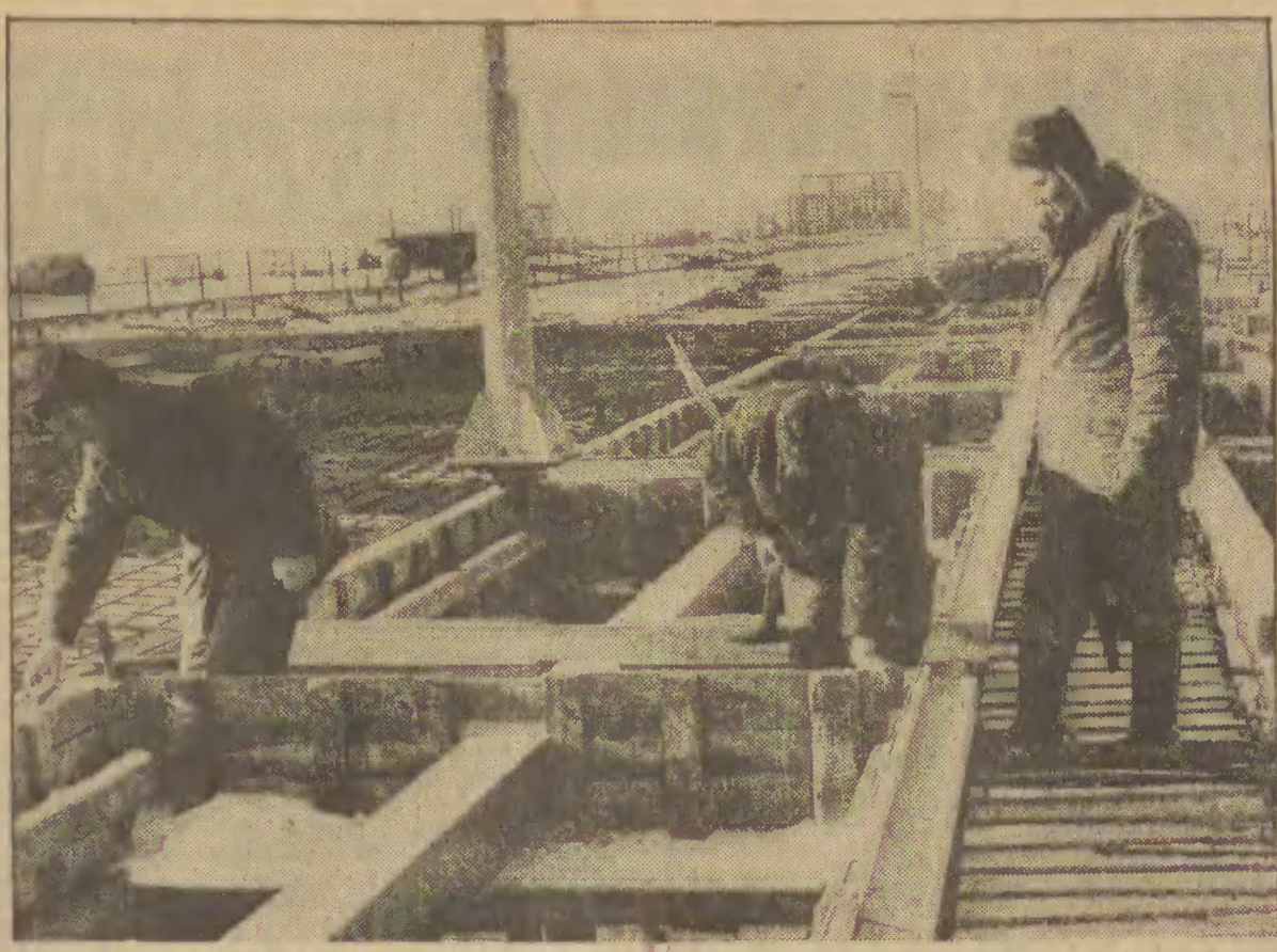
Prace aktualnie wykonywane na piśmie rudozym w Parcie Północnym...