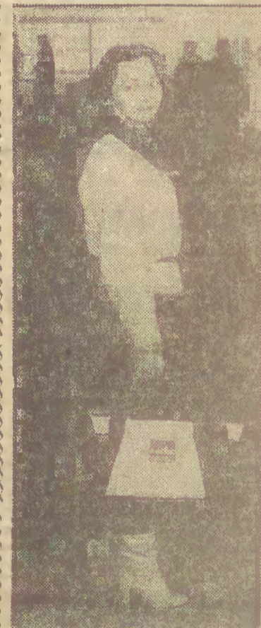
Na zdjęciu: torba ta jest bardzo wygodna w noszeniu.

Podobnie jak u nas apteczka pierwszej pomocy, tak w Anglii ta podręczna torba coraz powszechniej stosowana jest przez osoby prywatne.