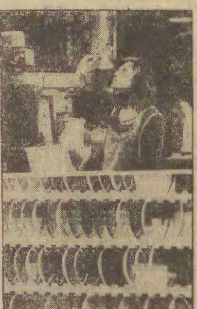
Na zdjęciu: w trakcie produkcji szklą okularowych; poniżej szklą z Jeleniogórskich Zakładów Optycznych.

Z chwilą uruchomienia produkcji w Jeleniej Górze, stały się dostępne na naszym rynku. Szklą te wyróżniają się wieloma istotnymi zaletami. Ich podstawową, wyjściową właściwością (zaciemnienie) wynosi 30 proc. Wzrasta ona pod wpływem działania promieni słonecznych i zależy od ich intensywności. Przy dużym nasłonecznieniu lub na śniegu dochodzi nawet do 80 procent. Zmiana zaciemnienia szklą następuje w czasie od 3 do 5 minut w zależności od mocy szklą.