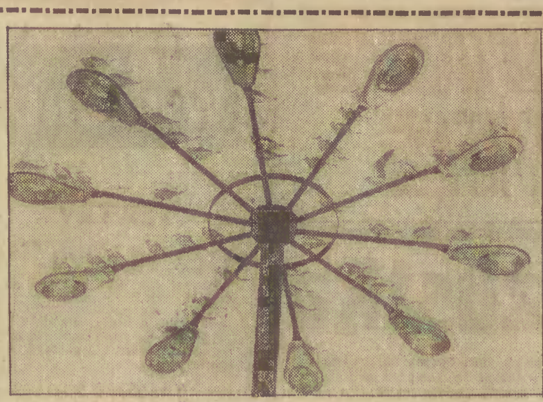
Chwila odpoczynku

W niedzielę, 22 bm. Wyższa Szkoła Marynarki Wojennej im. Bohaterów Westerplatte w Gdyni organizuje „dzień otwarty uczelni”. Wszyscy interesujący się zawodem oficera Marynarki Wojennej i służbą na morzu będą mogli od godz. 9.00 do 14.00 zapoznać się z warunkami naboru do uczelni, zwiedzić jej bazę szkoleniową i liczne gabinety dydaktyczno-wychowawcze. Po uczelni oprowadzać będą jej słuchacze. W programie m. in. projekcja filmów o Marynarce Wojennej oraz zwiadzenie okrętów szkolnych. Komenda i słuchacze WSMW zapraszają ponadto na kolejne „dni otwarte uczelni” 22 marca i 5 kwietnia br. Dojazd z Gdyni spod Dworca Głównego PKP autobusami komunikacji miejskiej 104, 150 i 128.