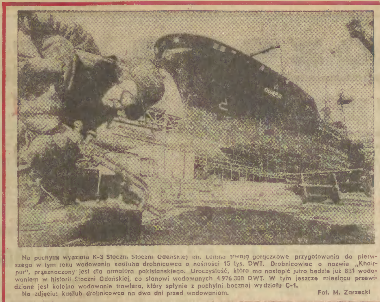
Na poczyniu wydziału K-3 Stoczni Stoczni Gdańskiej im. Lenina trwają gorączkowe przygotowania do pierwszego w tym roku wodowania karłowata drobnicowca o nośności 15 tys. DWT. Drobnicowca o nazwie „Khai-rpur”, przeznaczony jest dla armatorów pakistańskiego. Uroczystość, która ma nastąpić jutro będzie już 831 wodowaniem w historii Stoczni Gdańskiej, co stanowi wodowanych 4 976 300 DWT. W tym jeszcze miesiącu przewidziano jest kolejne wodowanie trawlera, który spłynie z pochylni bocznej wydziału C-1. Na zdjęciu: kadłub drobnicowca na dwa dni przed wodowaniem.