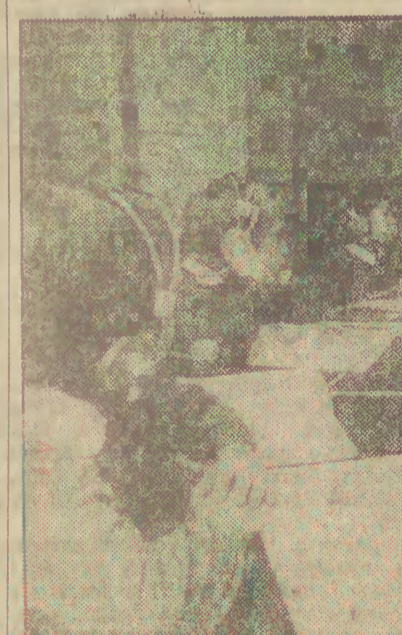
Na zdjęciu: lekcja w I klasie Szkoły Podstawowej nr 226 — Instytut Głuchoniemych w Warszawie.

słuchu. Posiadamy w kraju kilka placówek specjalistycznych dla dzieci głuchych, w tym w Warszawie Instytut dla Głuchoniemych, wraz ze szkołą podstawową, która spełnia jednocześnie rolę bazy naukowej-dydaktyczno-dosлідniczej. Dziecko od najwcześniejszego dzieciństwa powinno być otoczone specjalną troską i opieką medyczną, by mogło względnie normalnie się rozwijać.