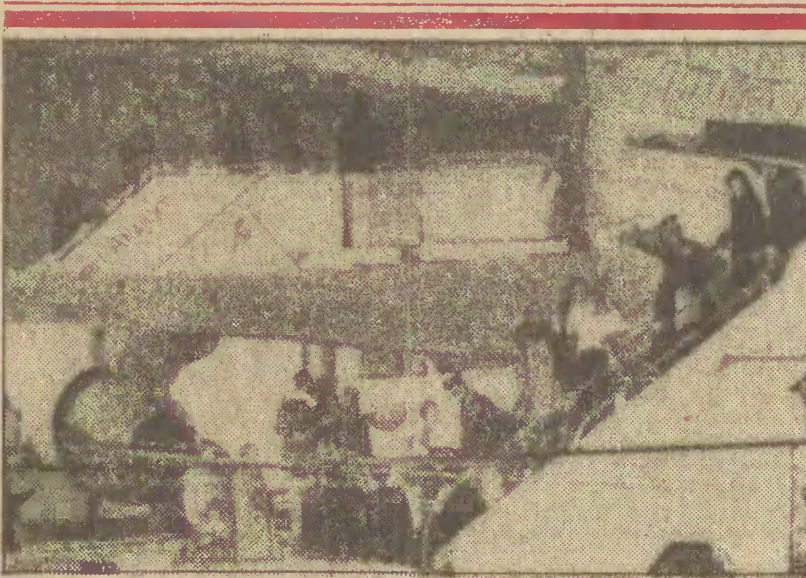
25 bm. na lotnisku pod West Point w stanie Nowy Jork wyładował samolot z 52 zakładnikami przetrzymywanymi przez 14 miesięcy w Iranie.