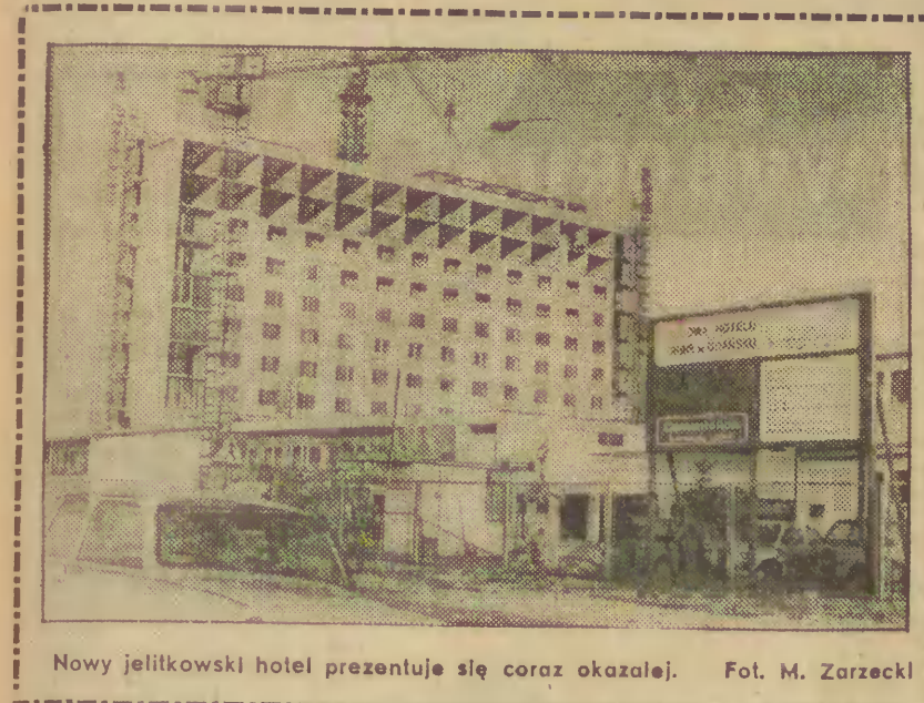
Nowy jellikowski hotel prezentuje się coraz okazalej.