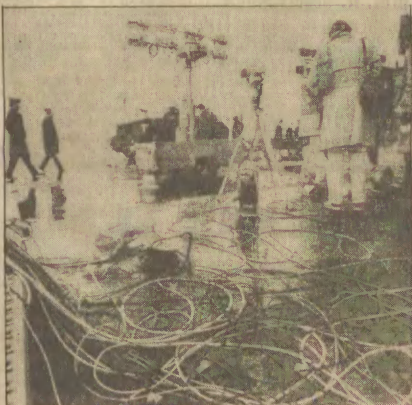
W bazie amerykańskich sił lotniczych w pobliżu Frankfurtu dziennikarze przyglądają się do transmisji z przylotu zakładników z Iranu.

W suchym porcie PKP w Małaszewiczach (woj. białostocko-podlaskie) trwa przeładunek radzieckich surowców dla naszego przemysłu, m.in. bawełny, lnu i włókna.