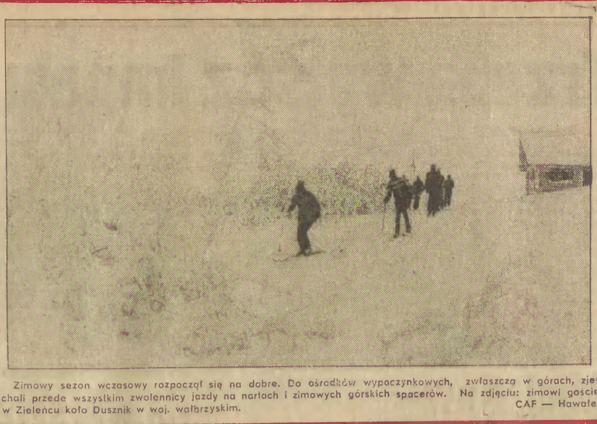
Zimowy sezon wczasowy rozpoczął się na dobre. Do ośrodków wypoczynkowych, zwłaszcza w górach, zjechali przede wszystkim zwolennicy jazdy na nartach i zimowych górskich spacerów.

Równoległe z najważniejszym obecnie — związanym z tegorocznym planem i budżetem — nurtami prac sejmowych, kontynuowana jest państwowa działalność w sferze lokalnej i badań terenowych.