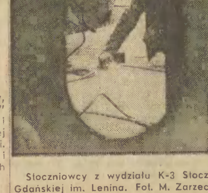
Stocznicy z wydziału K-3 Stoczni Gdańskiej im. Lenina.

W związku ze strajkiem pilotów, włoskie towarzystwo lotnicze „Alitalia” zawiesiło wszystkie loty zagraniczne i większość krajowych.