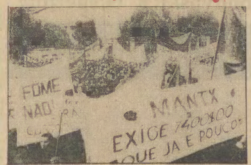
Demonstracja pracowników przemysłu tekstylnego w Oporto (Portugalia), domagających się podwyższenia płac. Ich strajk trwa już trzy dni.