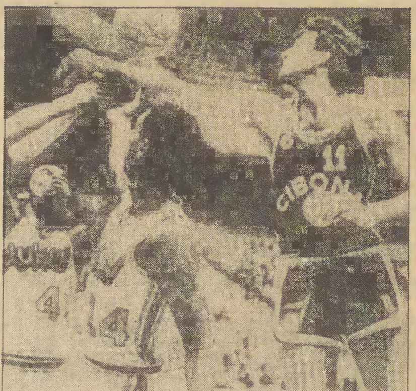
Koszykarze Jugosławii przebywają na tournée w USA. Oto fragment meczu, który rozegrali w Pittsburgu z zespołem Duguesne.