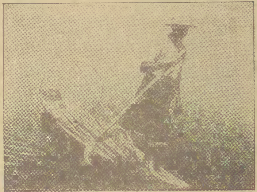
Rybacy z Birmy używają do połowów oryginalnie skonstruowane łódki, o napełnione przypominającym naszą hulajnogi. Urządzenie to pozwala na obserwowanie powierzchni wody i wypatrywanie ławic ryb.