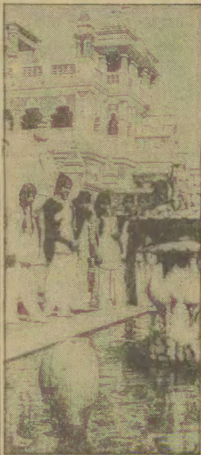
Indie. Świątynia poświęcona bogini szczęścia i piękności — Lakshmi należy do najbardziej okazałych budowli w Delhi. Zespół architektoniczny obejmuje kilka budynków, symboliczne rzeźby i wspaniały ogród z fontannami.