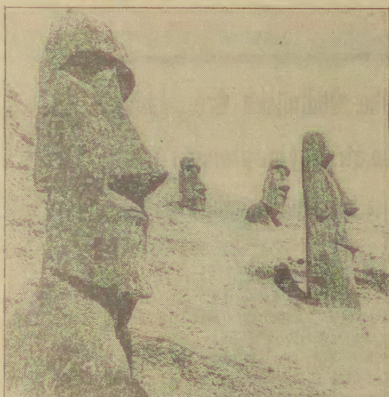
Wyspa Wielkanocna położona jest 3 tys. km. od wybrzeży Chile na Oceanie Spokojnym. Słynne kamienne posągi z długimi uszami, drewniane tabliczki pokryte nie odczytanymi znakami, rzeźby w drzewnie, stanowią do dziś zagadkę skąd się tu wzięły i kto jest ich twórcą.