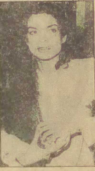
Bianca Jagger - żona szefa zespołu The Rolling Stones Micka Jaggera...