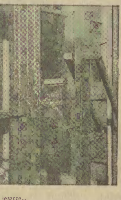
Mów do mnie jeszcze...