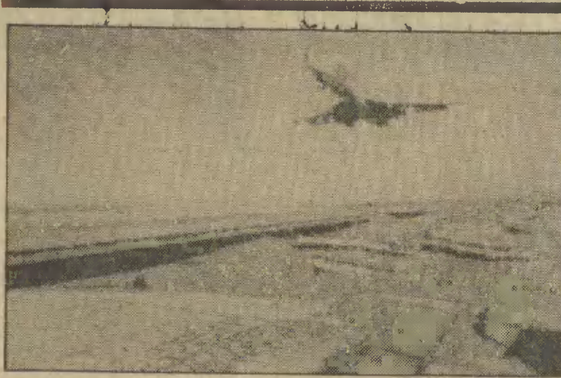
Na skutek powodzi, zniszczone zostały prawie wszystkie pasy startowe na lotnisku w Phoenix w Arizonie. Koszt reperacji wyniesie ponad 4 miliony dolarów.

W ubiegłym roku przybyło wsi (nie licząc sektora uspołecznionego) prawie 100 tysięcy nowych mieszkań. (Dokończenie na str. 2)