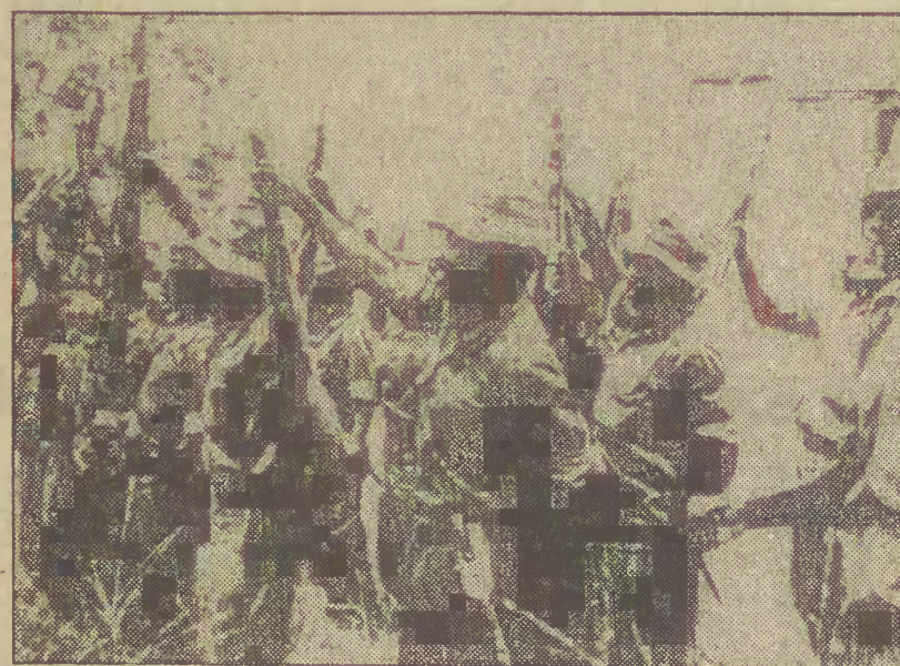
Organizacja Ludności Afryki Południowo-Zachodniej (SWAPO) powołała Ludową Armie Wyzwolenia Namibii. W ciągu ostatnich trzech miesięcy patryjcy SWAPO odnieśli znaczne sukcesy w walce z okupującymi Namibię wojskami RPA. Na zdjęciu: jeden z oddziałów sił narodowowyzwoleńczych SWAPO.