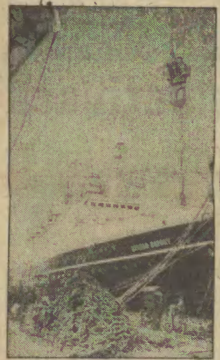
Na zdjęciu: statek przy nabrzeżu stoczni.