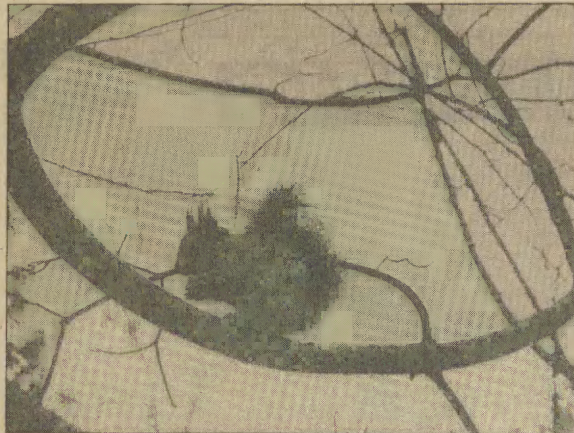
Wiosenne spotkanie w parku oliwskim.