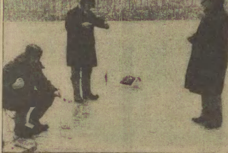
Minusowe temperatury na Wybrzeżu skutki wreszcie lodem nasze jeziora. Radość to oczywiście nie tylko dla miłośników sportu...