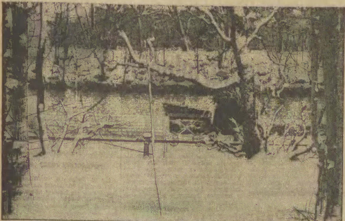
Park oliwski