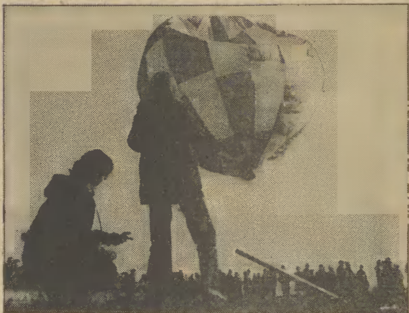
Moment szczególnej emocji dla zawodnika: balon poleci jeszcze trochę więcej czy zacznie opadać?