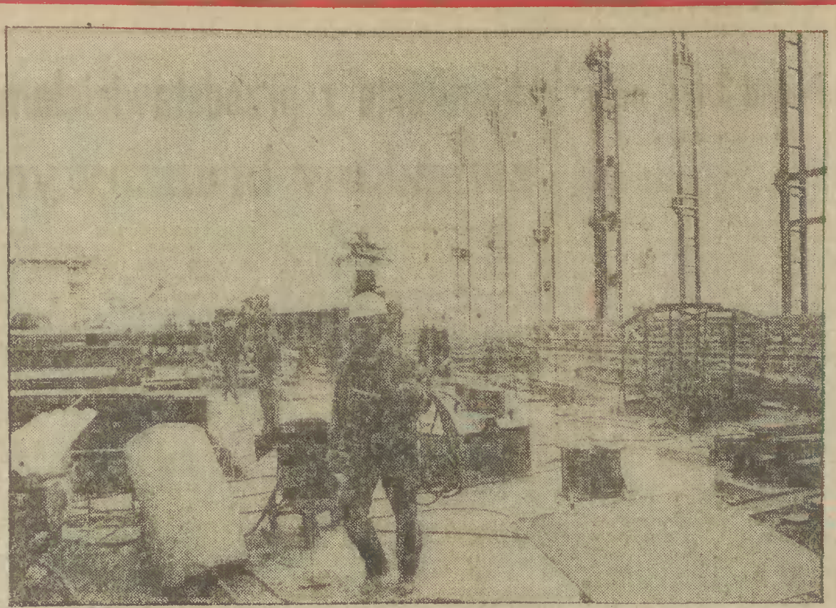
Elektrociepłownia w Łęgu ogrzewa 70 procent budynków Krakowa, posiadających centralne ogrzewanie. Siłownia dysponuje obecnie mocą, pozwalającą na ogrzanie mieszkań, gdy temperatura na zewnątrz sięgać będzie do minus 10 stopni, przy większych mrozach niestety w mieszkaniach będzie chłodniej. Wynika to m. in. z opóźnień inwestycyjnych.

Komisja Koordynacyjna NSZZ „Solidarność” Drogowców z woj. śląskiego i górnośląskiego oświadczyła, że drogowcy nie mogą brać odpowiedzialności za zimowe utrzymanie dróg na tym terenie, ponieważ mimo wielokrotnych monitorów nadal brakuje ponad tysiąca opon i 345 akumulatorów. Jeżeli potrzeby te nie zostaną natychmiast zrealizowane, na drogach tych dwóch województw będzie mogło pracować tylko 20 proc. sprzętu przewidzianego do akcji zimowej. N.z.: plug witrnikowy — w tym miejscu powinny znajdować się akumulatory których brak.