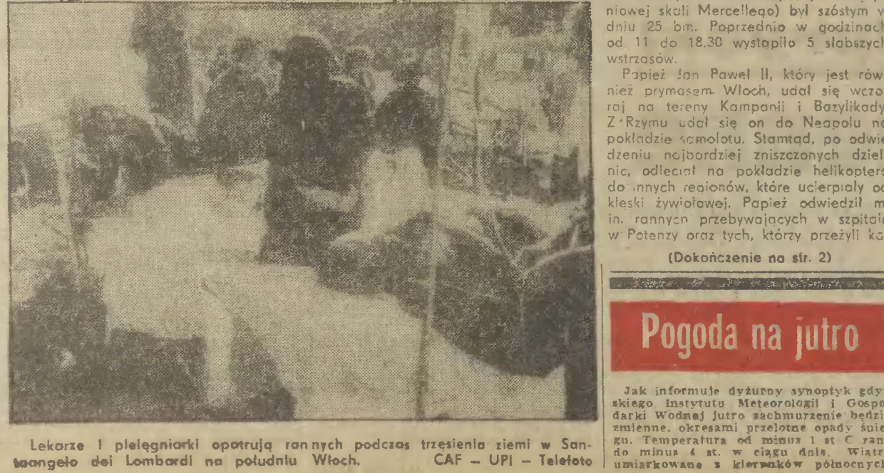
Lekarze i pielęgniarze opatrują rannych podczas trzęsienia ziemi w San-angelolo dei Lombardi na południu Włoch.

TRZĘSIENIE ziemi, które w ub. niedziele nawiedziło dwa regiony południowych Włoch było, jak się obecnie okazuje, straszliwym kataklizmem. Wstrząs o sile od 6 do 9,5 stopnia w 12-stopniowej skali Mercalli