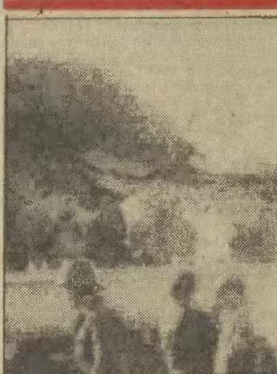
W pobliżu miasta Catanzaro na południu Włoch nastąpiło w nocy z 21 na 22 bm. zderzenia dwóch pociągów. W katastrofie zginęło 27 osób, a 120 zostało rannych. Liczba ofiar śmiertelnych może być większa, gdyż niedość ratowników przeszkadzających zmiarzone wagi. Na zdjęciu: na miejscu katastrofy.

— dyskusja na forum Sejmu świadczy, że najwyższy organ władzy państwowej podziela w podstawowych elementach stanowisko rządu, zarówno w ocenie trudnej sytuacji kraju, jak i drogę prowadzącą do rozwiązania istniejących problemów.