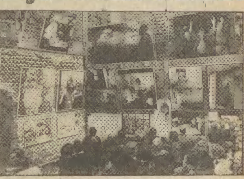
„Utrwalone na kliszy obrazy ukazują klimat

Tak się złożyło, że w kilka dni później w Galerii Fotografii „GN” przy ul. Plebani odbył się wernisaż wystawy znanego gdańskiego fotografa — Witolda Węgrzyna. Wystawa ta w sensie gatunku skrajnie różni się od tej w Wielkim