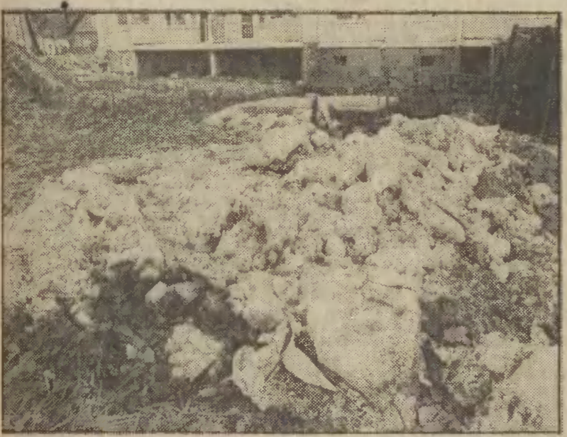
Listopad 1980 — resztki skamieniałego już gipsu przy ul. Chyłośkiej w Gdyni.

Z terenów budowy wymienionych osiedli wynieśliśmy wtedy — przez nikogo nie zatrzymywani — należące do Gdańskiego Kombinatu Budowy Domów: rolkę papu, worek wapienia, rury wodociągowe, okno piwniczne; będące własnością GPB: okno pokojowe, metalową osłonę deski rozdzielczej, pa-