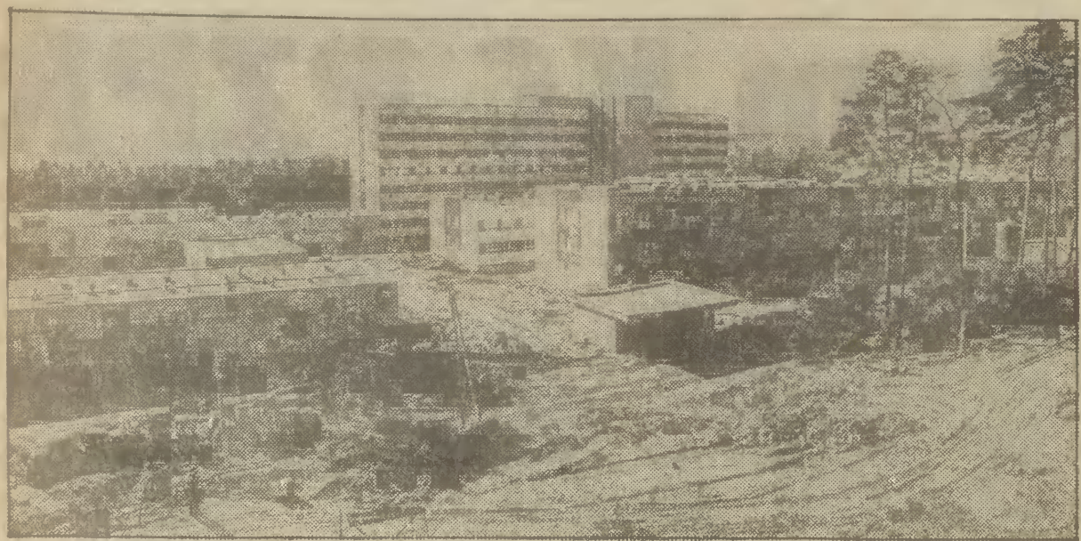
Ogólny widok terenu budowy wejherowskiego szpitala.