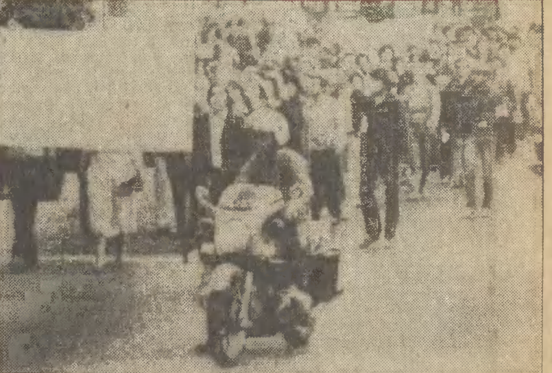
1 bm. w Monachium odbył się marsz protestacyjny przeciwko działalności neofaszystów w RFN. Jak wiadomo, w ubiegłym tygodniu członkowie tego ugrupowania dokonali w Monachium zamachu bombowego, w wyniku którego zginęło 13 osób. CAF - AP - Telefot

Jak informuje dzienne synoptyk gdańskiego Instytutu Meteorologii i Gospodarki Wodnej, jutro zachmurzenie będzie małe, po południu duże i miejscami deszcz. Temperatura od 5 st. C rano do 16 st. C w ciągu dnia, nocą lokalne przegrzanie przyniosą. Wiatry słabe, po południu umiarkowane z kłębników podulicznych. W niedzielę i w poniedziałek przelotne opady deszczu. Temperatura bez większych zmian.