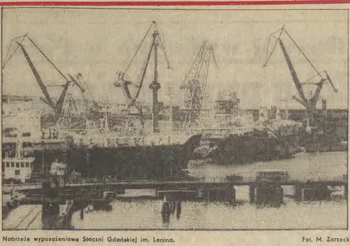
Nabrzeże wyposażeniowa Stoczni Gdańskiej im. Lenina.

Rzecznik Reagana natomiast oświadczył, że nie ma wiadomości o planach włączenia b. prezydenta do ewentualnego gabinetu Reagana, ale nie wykluczył kategorycznie możliwości powierzenia Nixonowi misji dyplomatycznych.