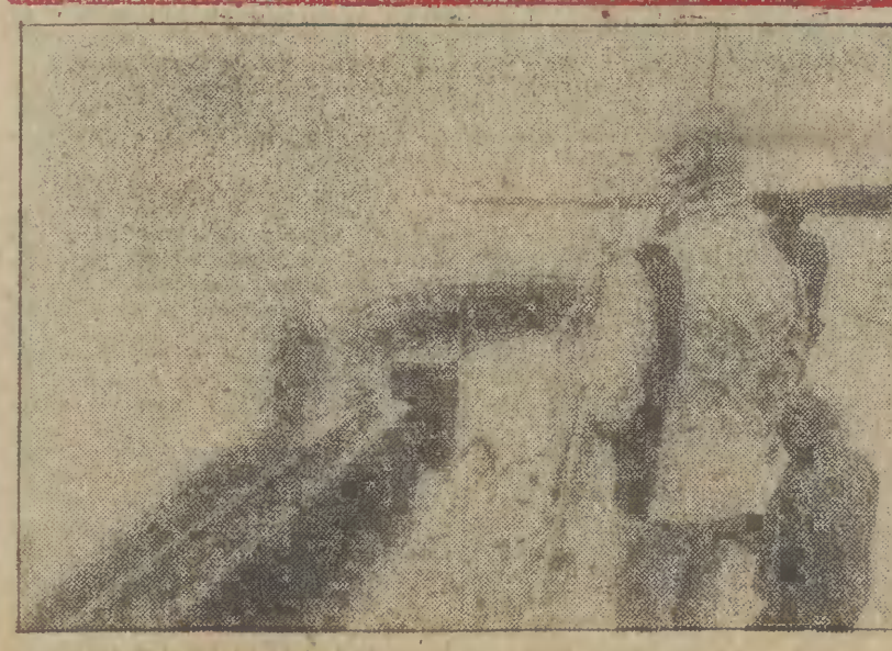
Lato ma się ku końcowi, a w Kolobrzegu już prawdziwie jesienno-zimowo.