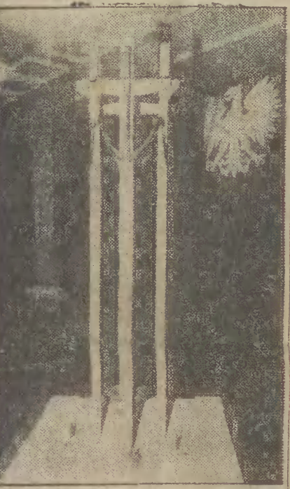
Makieta Pomnika Poległych Stoczniovców 1970.