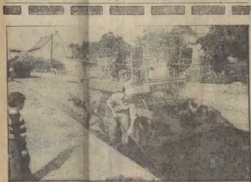
Układanie nawierzchni asfaltowej na ul. Wyczółkowskiego.

W piątek, 12 bm. w Gdańsku-Zaspie zginął owczarek niemiecki. Ma długą sierść czarno-rudej. Jest chory i wymaga dalszego leczenia. Tymczasowo opiekun proszony jest o wiadomość, telefon 53-01-09.