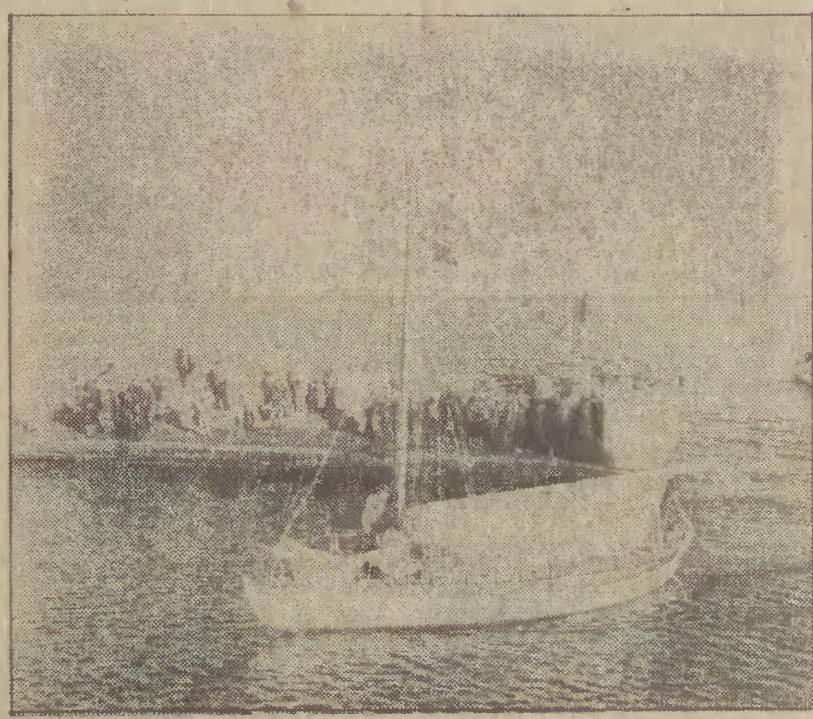
Jacht „Dal” wpływa do Gdyni.