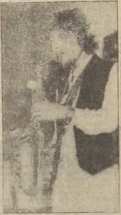
W dzisiejszym programie jazzowym...