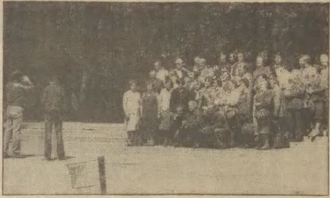
Grupowe zdjęcie to też pamiątka z pobytu na Westerplatte.