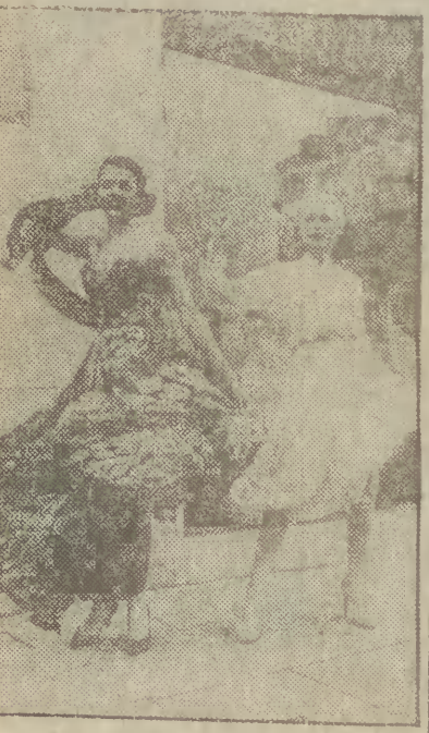
Ta powiewna sukienka z jedwabnego muślinu to propozycja na jasnoniebieskie okazje wieczorowe projektu Jean Herceya z Paryża.