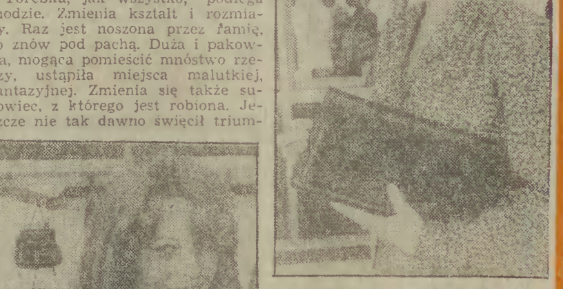
Na zdjęciu: na ostatnich Międzynarodowych Targach w Poznaniu zaprezentowano wiele udanych wzorów torebek wykonanych przez spółdzielców pracy. Obć dwie z nich.

„Bez toreбки czuję się, jak bez ręki” - zwykli mawiać panie. I nie w tym dziwno. Jest ona bowiem nieodzownym dodatkiem do ubioru, nie mówiąc już o jej funkcji praktycznej. Psychologowie twierdzą, że już po bieżnym rzut oka na torebkę i wartość pozwalają wyrobić sobie pewien sąd o właścicielce. Torebka, jak wszystko, podlega modzie. Zmienia kształt i rozmiar. Raz jest noszona przez famię, to znów pod pachą. Duża i pakowna, mogła pomieścić mnóstwo rzeczy, ustąpiła miejsca małej, fantazyjnej. Zmienia się także surowiec, z którego jest robiona. Jeszcze nie tak dawno świecił trium-