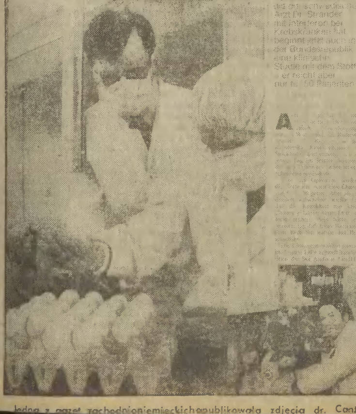
Idąc z zamiarem zachodniemieckich opublikowała zdjęcia dr. Cantella