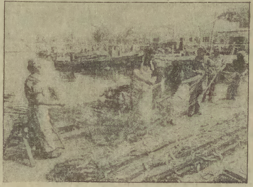
Port rybacki w Rowach koło Uski. Rybacy powrócili właśnie z udanego połowu i wraz z rodzinami wybierają z łowioną rybą z sieci.

Pierwsze półtoro- bałtyckich rybaków, którzy znacząco przekroczyli zadania planowe. Rybacy znieśli w spółdzielniach Krajowego Zw. Spółdzielczości Rybackiej w ciągu 6 miesięcy br. wykonali prawie 80 proc. planu rocznego, chociaż czterwiec okazał się miesiącem słabych połowów.