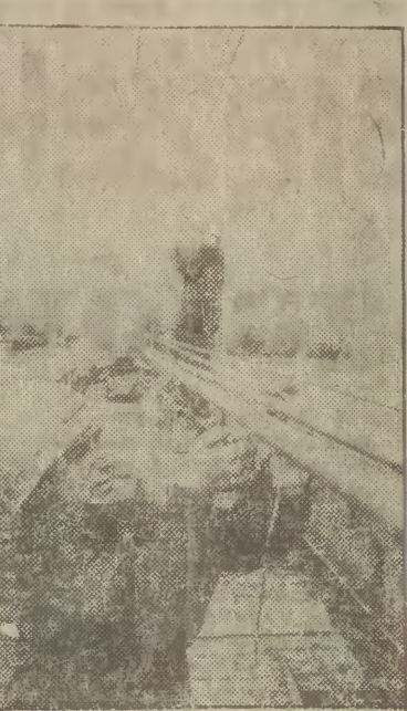
Do końca tego roku 667 elektryfikowanych linii kolejowych liczyć będzie pogoda 7 tysięcy kilometrów. Poćiągi z elektrowozami wykonawcą będą ponad połowę pracy przewoźniczej kolei. Zwiększa się siła elektryfikacji na Pomorzu Zachodnim. W tym roku zakończy się elektryfikacja odcinka Gostów — Świnoujście (woj. szczecińskie). Tym samym zostanie zakończona elektryfikacja linii kolejowej, prowadzącej ze śląskich kopalni i hut do portów nadmorskich.

Na zdaniu: prace przy podwieszaniu sieci trakcyjnej na odcinku Wysoka Kamińska — Reclaw (woj. szczecińskie).