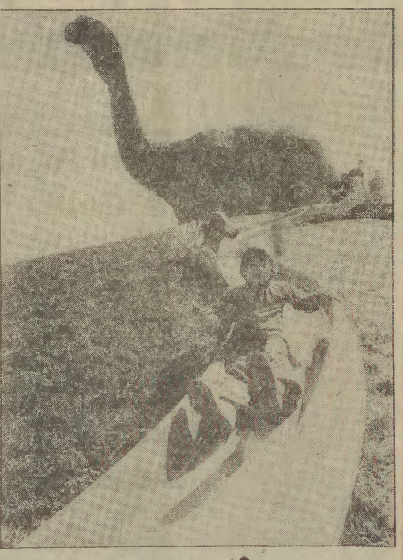
U stóp kamiennego dinosaura „strzegącego” przelazłych terenów wystawy „Zielen 80” w Bazylei - wspaniała jeździźnia dla najmłodszych gości.

Produkty: śledź bałtycki, świeży, duży - 2 kg, mąka wrocławska - 20 dkg, olej sojowy - 25 dkg, cebula 15 dkg, koncentrat pomidorowy 30 proc. - 15 dkg, sól - 10 dkg, cukier - 1 dkg, pieprz naturalny, papryka mielona, ziele angielskie, liść laurowy. Śledzie należy odgłowić i wypłóczyć, umyć i zasołić. Czas solenia ca 15 minut. Następnie obtoczyć je w mące i smażyć na rozgrzanym oleju. Smażony zawsze przy otwartym oknie. Do podsmażonej cebuli dodać mąkę, zasmażać, rozprowadzić wodę dodając koncentrat pomidorowy oraz przyprawę, dokładnie mieszając zagotować. Usmażone śledzie ułożyć na półmisku i zalać przygotowanym sosem. Potrawę można podawać z ziemną na gorąco.