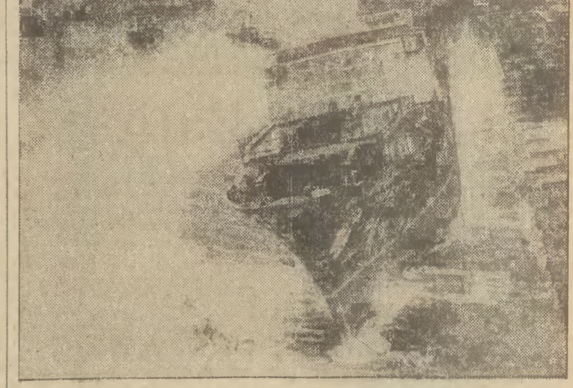
Gdańsk, 30. VI 1980 r. W Stacji Północnej im. Bahaterów Westerplatte odbyło się wodowanie ostatniego z serii 10 supersejnerów B-406...