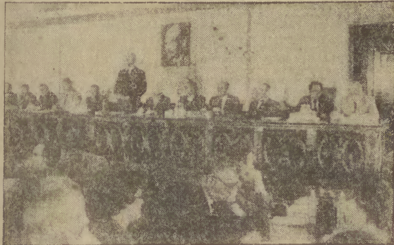
Na zdjęciu: podczas obrad.

W Warszawie odbyło się wczoraj III plenarne posiedzenie Komitetu Centralnego Polskiej Zjednoczonej Partii Robotniczej. Obradom przewodniczył I sekretarz KC — EDWARD GIEREK.