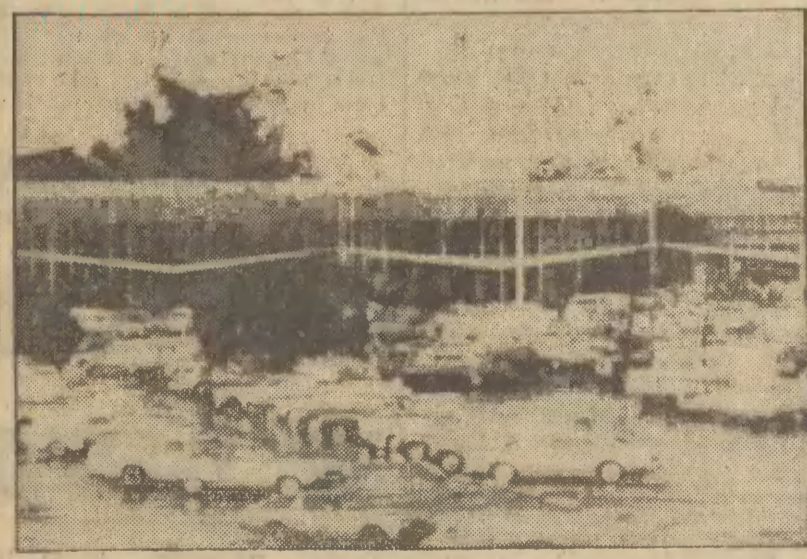
Straty materialne po ulewnych deszczach i huraganach w Kalifornii sięgają milionów dolarów. W wielu miejscowościach huragan zburzył dziesiątki domów...