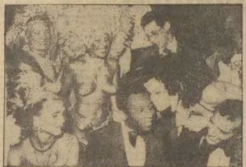
W nocy z 19 na 20 bm. w Rio de Janeiro zakończył się tradycyjny karnawał. Jednym z uczestników karnawałowego staleństwa był Pele...