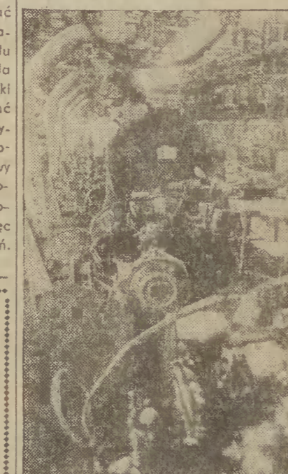
Na zdjęciu: montaż silników w FSM Bielsko - Biala.

Później ich wytwarzanie przejął zakład w Tychach, a w Bielsku zaś rozwinięto produkcję zespołów napędowych i samochodów „Syrana”. W 1974 roku rozpoczęliśmy eksport silników do Włoch, spłacając w ten sposób w pełni zaciągnięte kredyty dewizowe na zakup maszyn i urządzeń. Dotychczas w Bielsku wyprodukowano około 1 milion 300 tys. silników - większość trafiła na eksport