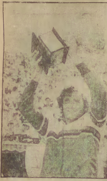
Nie ma przestójki w światowym tenisie. W nocy z wtorku na środę zakończono w Melbourne tenisowe mistrzostwa Australii...