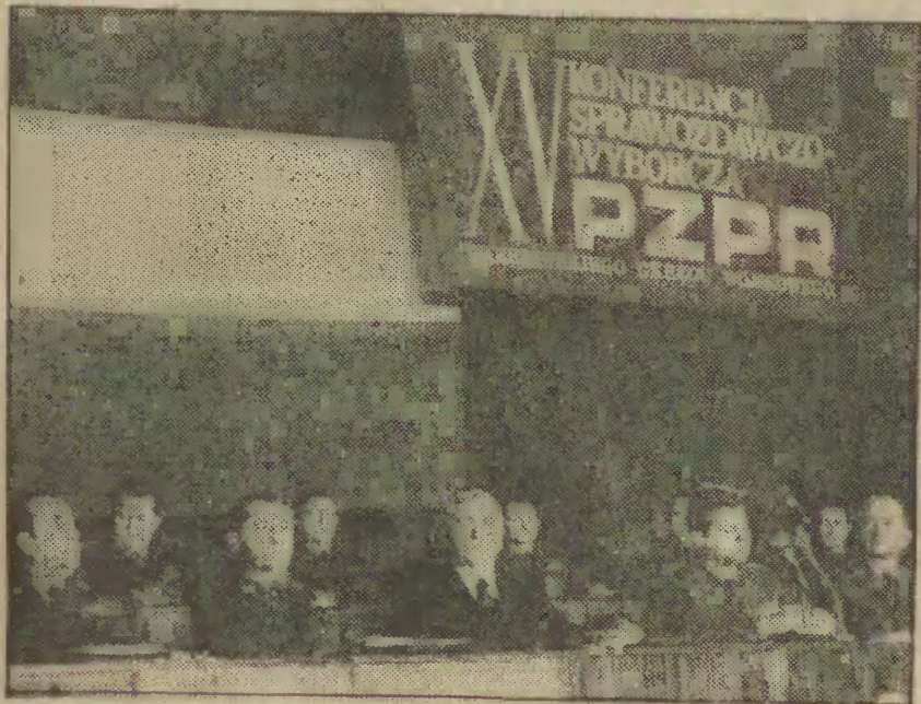
Na zdjęciu: podczas konferencji.

Wczoraj z udziałem I sekretarza KC PZPR EDWARDA GIERKA obradowała w Warszawie sprawozdawczo-wyborcza konferencja partyjna Warszawskiego Okręgu Wojskowego.