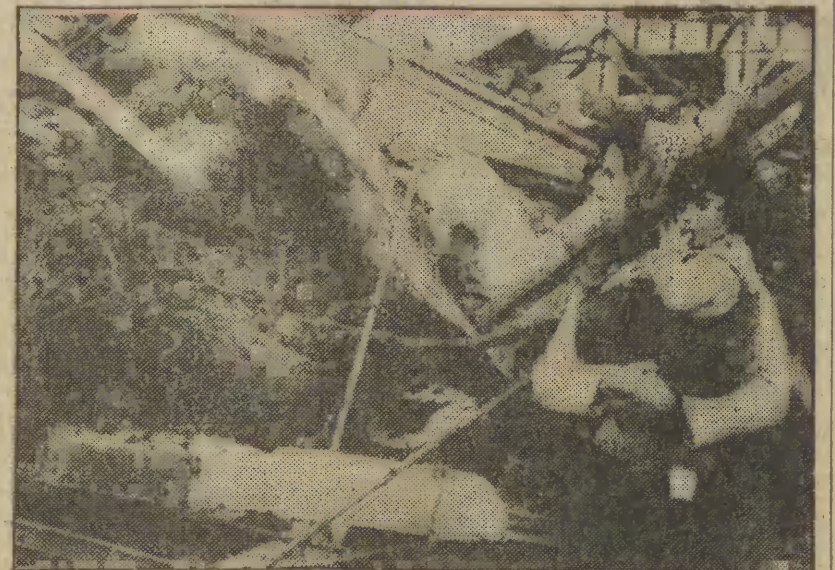
Archipelag Azorów na Atlantyku nawiedziło trzęsienie ziemi. 35 osób poniosło śmierć, ponad 300 zostało rannych. W gruszech legły setki domów.