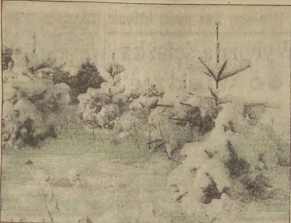
Zima na Kaszubach.