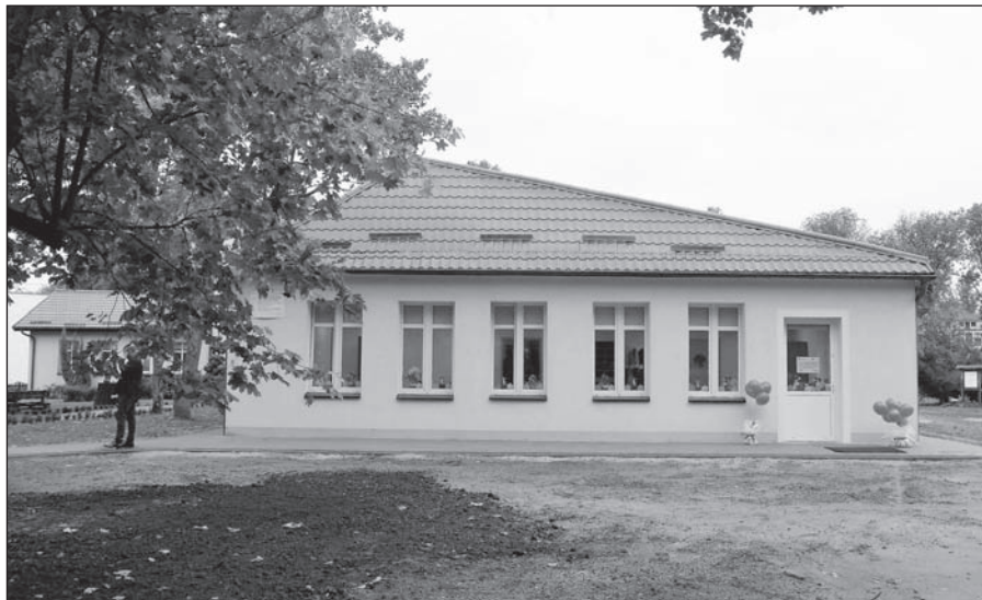
Przedszkole Nr 4 przy ulicy Augusta Cieszkowskiego