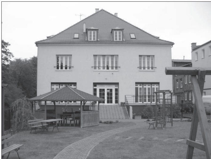
Budynek Miejskiego Ośrodka Pomocy Społecznej

Miejski Ośrodek Pomocy Społecznej w Sławnie powołany został uchwałą Rady Miejskiej z 14 maja 1992 roku.