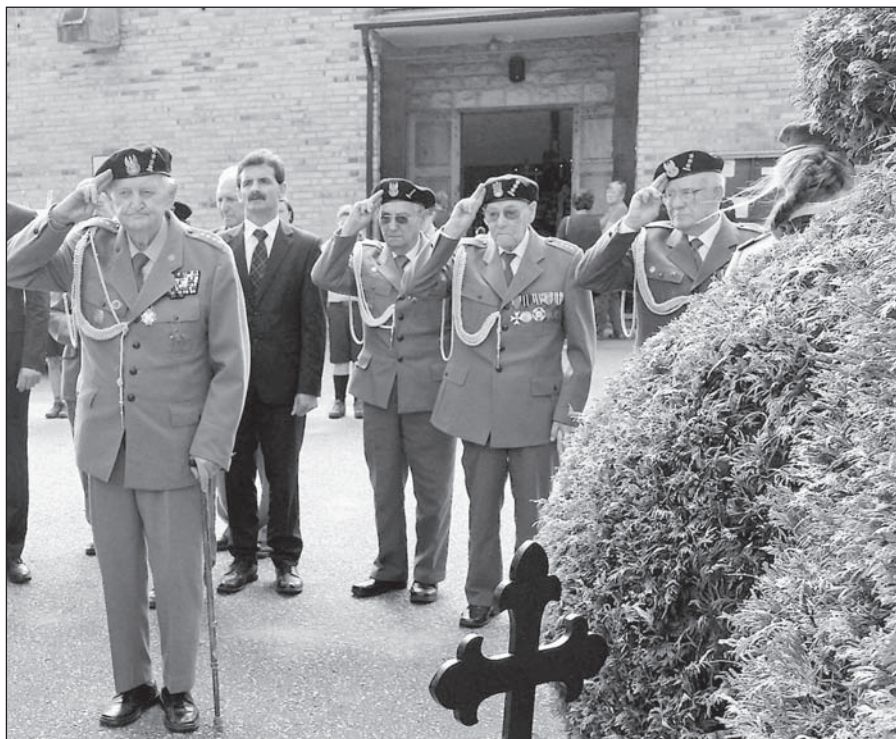
Weterani na cmentarzu komunalnym w Sławnie

W latach 90-tych sytuacja zaczęła się zmieniać. Obok struktur terenowych organizacji o zasięgu ogólnopolskim powstawały lokalne stowarzyszenia i fundacje.