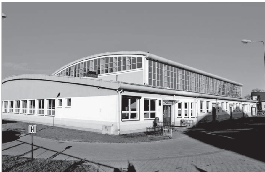
Hala sportowo – widowiskowa przy Szkole Podstawowej Nr 3

Na początku lat 90-tych w mieście nadal działały trzy szkoły podstawowe. Stały wzrost uczniów spowodował, że w końcu lat 80-tych rozpoczęto budowę nowego pawilonu w Szkole Nr 3.