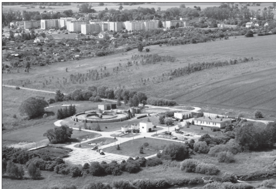
Oczyszczalnia ścieków – największa inwestycja komunalna w latach 90-tych XX wieku