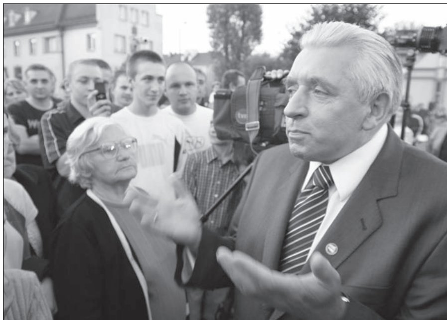
Andrzej Lepper – przewodniczący Samoobrony wśród mieszkańców Sławna

Samoobrona RP założona została w 1992 roku przez rolnika spod Darłowa Andrzeja Lepera na fali niepokojów społecznych na początku lat 90-tych XX wieku, zwłaszcza w rolnictwie, które przeżywało ostry kryzys. Likwidacja państwowych gospodarstw rolnych – jedna z nieprzemyślanych do końca (a może przemyślanych ?) reform Balcerowicza – spowodowała, że ich pracownicy pozostawali bez środków do życia.