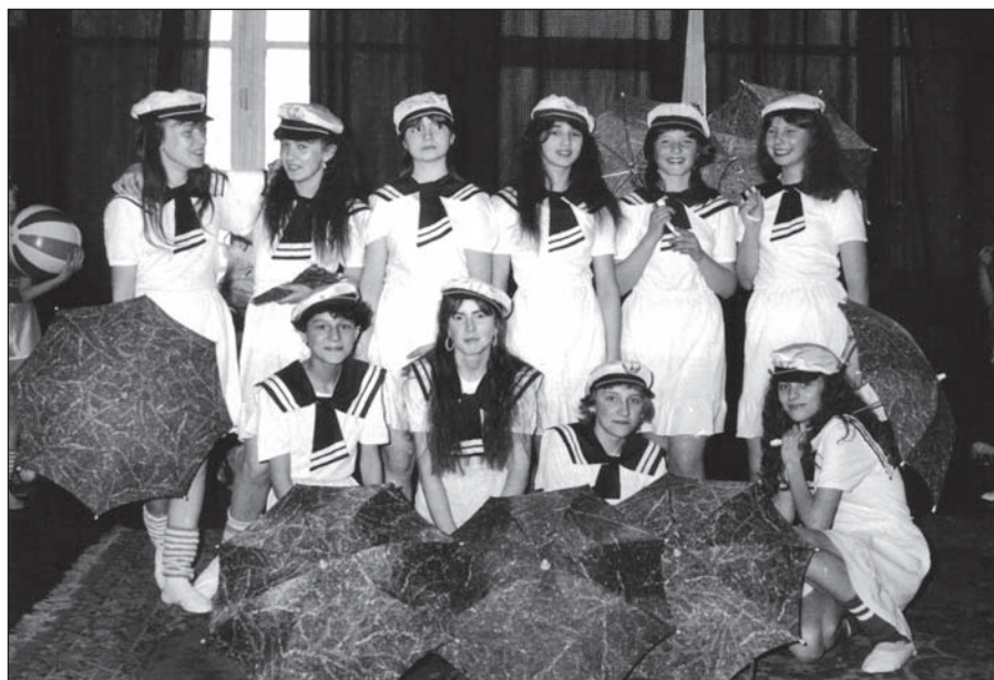
Zespół Piosenki i Tańca „Nastolatki”