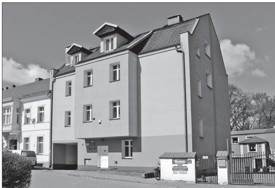
Nowy budynek biblioteki czynny od stycznia 1992 roku

Na terenie Szkoły Podstawowej Nr 1 działa filia biblioteki obsługująca południową część miasta (wcześniej mieściła się przy ulicy Moniuszki). Znajduje się tam czytelnia i wypożyczalnia.