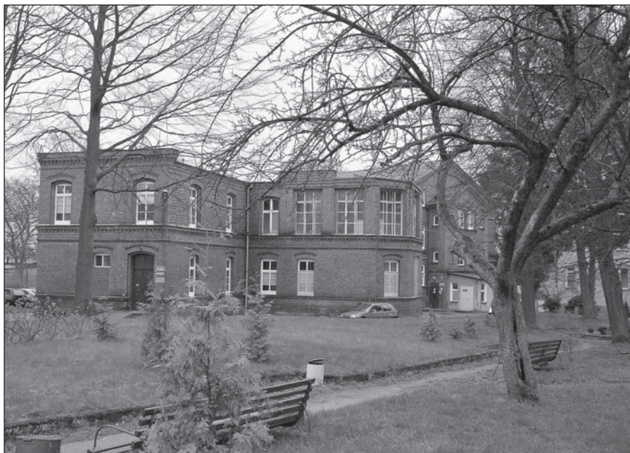
Budynek chirurgii sławińskiego szpitala

Dokonano wtedy kapitalnego remontu budynku reumatologii, zamontowano w nim pierwszą w szpitalu windę. Kolejne remonty przeprowadzono w budynkach chirurgii i oddziału wewnętrznego. Także tam zamontowano windy.