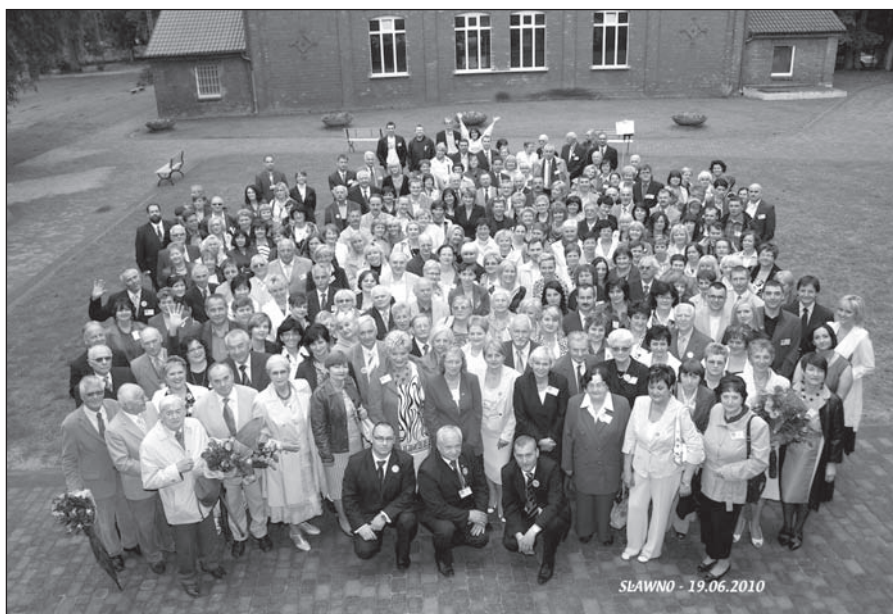
Uczestnicy zjazdu Absolwentów Liceum Ogólnokształcącego w 2010 roku

Przemiany ustrojowe w 1989 roku znalazły także odbicie w murach szkoły. W 1990 roku Liceum rozpoczęło współpracę ze szkołą średnią w Rinteln. Także w tym roku odbyło się spotkanie polskich i niemieckich absolwentów szkoły.