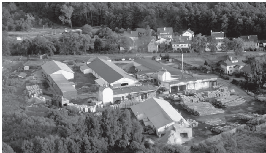
Powstałe w latach 90-tych XX wieku Zakłady Drzewne „Poldan” przy ulicy Gdańskiej

Profil produkcji obu zakładów jest ogromny: od kantówki, więźby dachowej, płyt meblowych, tarcicy iglastej i liściastej po domki drewniane. Powstaje tu też ekologiczne paliwo – brykiet drzewny i pelet oraz kora sosnowa do pokrywania powierzchni gleby.