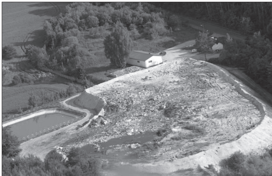
Sławińskie wysypisko śmieci zlokalizowane w Gwiazdowie.

Niestety nawierzchnie wielu ulic pozostawiają wiele do życzenia. Nawierzchnia dawnej reprezentacyjnej ulicy miasta Jedności Narodowej – to źle ułożona dawna kostka. Szpary między kostkami są duże (choć wcześniej kostka przylegały do siebie). Zły podkład powoduje, że w czasie mrozów kostki są wypychane do góry. Na domiar złego zamiast zrobić – jak na przykład w Darłowie deptak – urządzono byle jaki parking.