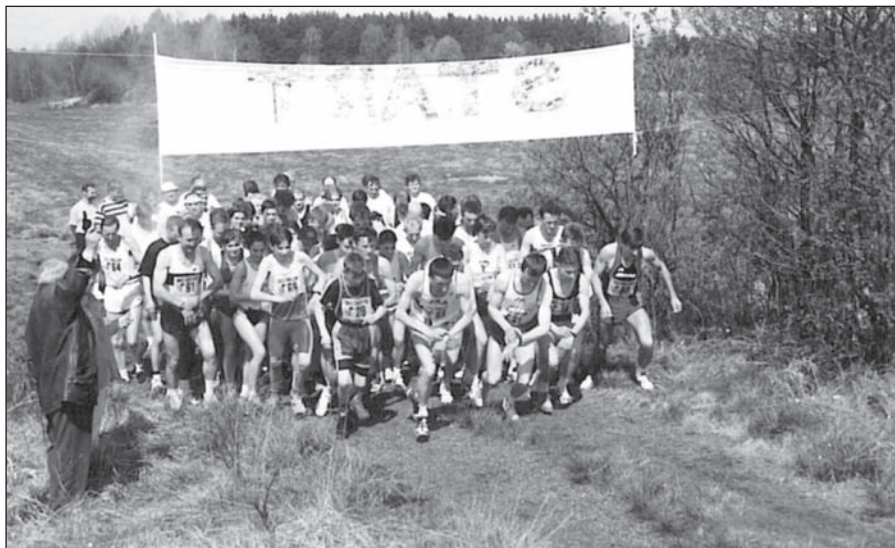
Start do majowego Biegu Święców na wczesnośredniowiecznym grodzisku we Wrześnicy