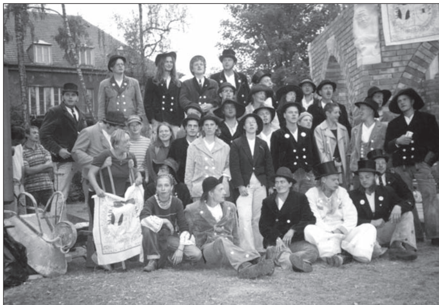
Plener Wędrujących Czeladników, wrzesień 1999