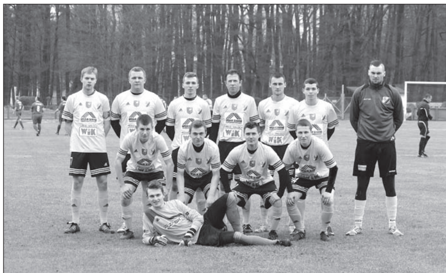
Piłkarska drużyna „Sławy”, początek 2016