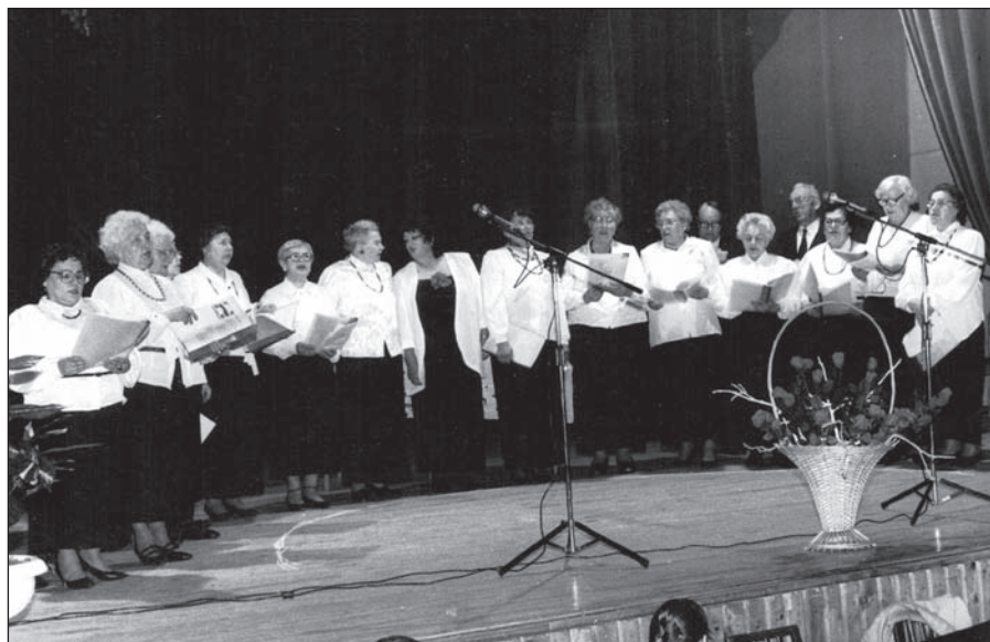
Zespół wokalny „Babulińki”, 1993