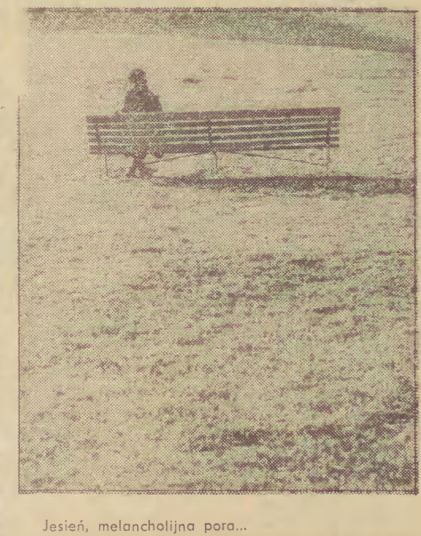
Jasień, melancholijna pora...