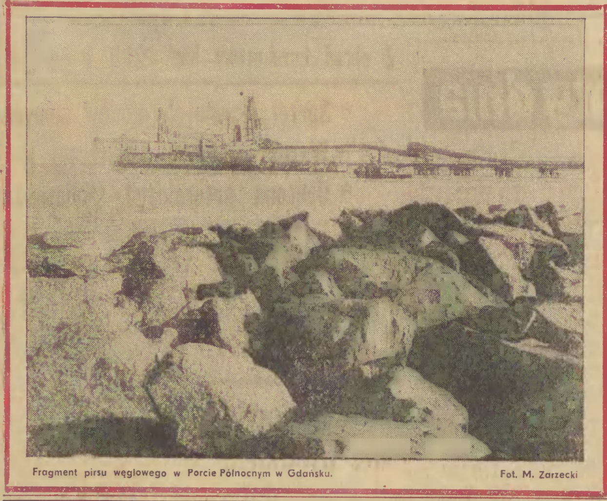
Fragment pirsu węglowego w Porcie Północnym w Gdańsku.

Z okazji drugiej rocznicy proklamowania niepodległości Anglii, przypadającej w dniu 11 bm., sekretarz Komitetu Centralnego PZPR Edward Gierek, przewodniczący Rady Państwa Henryk Jablonski i prezes Rady Ministrów Piotr Jaroszewicz wystosowali depeszę gratulacyjną do przewodniczącego Ludowego Ruchu Wyzwolenia Angolii, prezydenta Ludowej Republiki Angolii Agostinho Neto i premiera Ludowej Republiki Angolii Lopo Fortunato Ferreira do Nascimento.