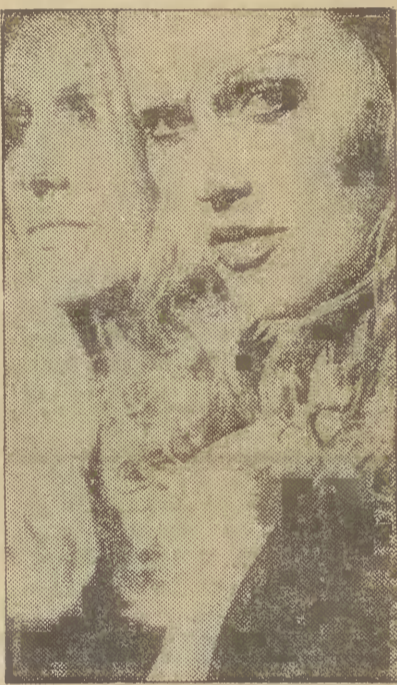
Portret z sobowtorem.