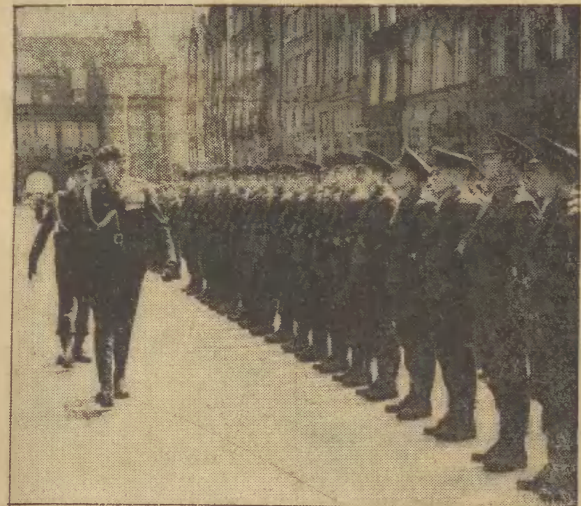
Odprawa wart na Długim Targu