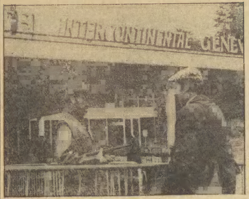
9 bm. w Genewie odbyło się spotkanie prezydenta USA Jimmy'ego Cartera z prezydentem Syrii Hafezem Asadem. Tematem spotkania była sytuacja na Bliskim Wschodzie. N/z.: uzbrojony policjant przed hotelem w Genewie gdzie odbyło się spotkanie.