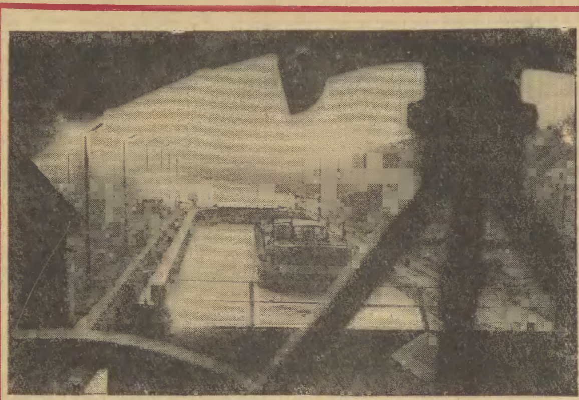
Odra — najpoważniejszy szlak transportu wodnego, służy do przewozu z portu szczecińskiego m. in. ropy naftowej i innych towarów dostarczanych z zagranicy przez nasze statki. Trafiają one do uprzemysłowionych ośrodków na południu kraju. Równocześnie jest na północ węgiel i inne surowce przeznaczone na eksport.

N/z.: barka z fosforytami dla Wrocławia na służbę Różanka na Odrze.