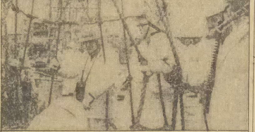
Grupa ekspertów która przedostała się na platformę wiertniczą „Bravo” na Morzu Północnym, musiała 26 bm. wycpać się na skutek złej pogody i oparów gazu wydobywającego się wraz z ropą naftową z szybki.