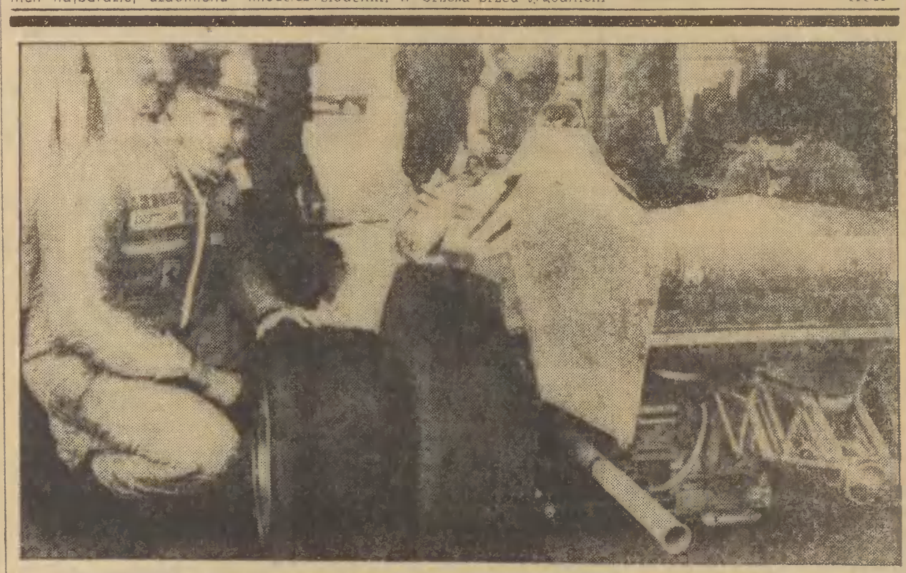
Byli mistrz świata w wyścigach samochodowych Niki Lauda rozpoczął na włoskim torze Nario k. Brindisi wyścig bolidem nowego 6-kolowego modelu Ferrari.