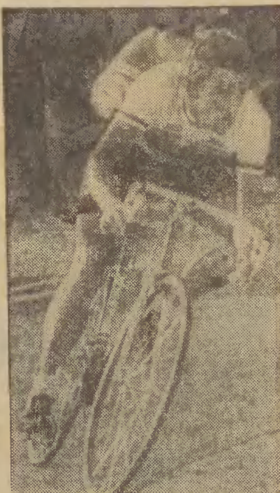
Wczoraj zakończył się kolarski wyścig „open” Paryż - Nicea...