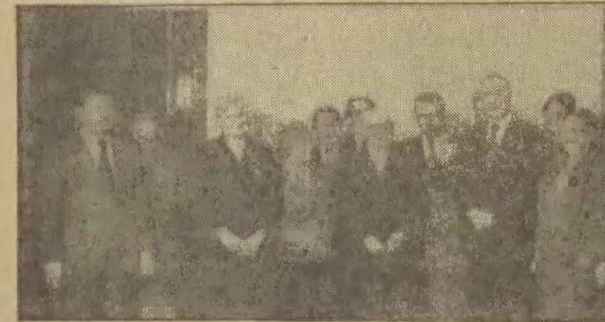
N/z: Edward Gierki i Henryk Jablonski podczas spotkania.

Dyskusja na naradzie wykazała, że samorządność mieszkańców miast jest jedną z form ludowladzstwa i służy rozszerzeniu demokracji socjalistycznej. Działacze samorządu podejmowali w ostatnich la-