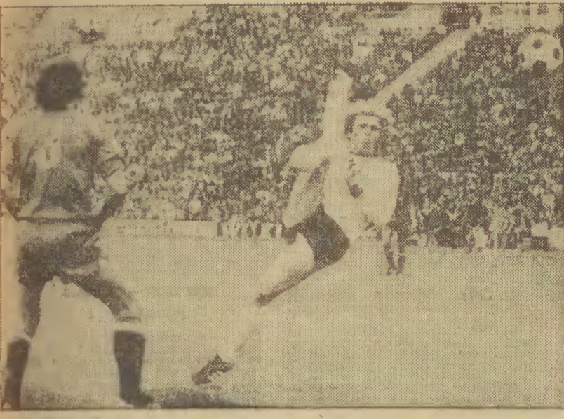
Znowu ruch na europejskich stadionach