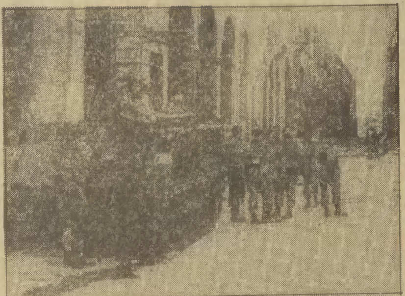
Włochy, 13 bm. w kilku miastach Włoch doszło do gwałtownych starć między policją, a demonstrującymi studentami. N/z: uzbrojeni policjanci na ulicach Bolonii

Algerze, do gwałtownych starć między policją, a demonstrującymi studentami. N/z: uzbrojeni policjanci na ulicach Bolonii