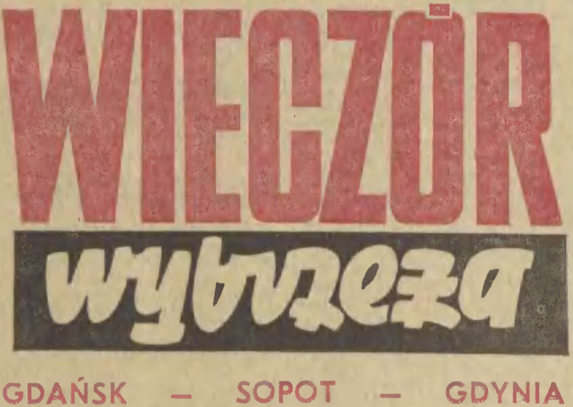
GDĄŃSK — SOPOT — GDYNIA

Nr 59 (6313) Wtorek, 15 marca 1977 r. Cena 1 zł