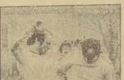
Gra obfita w ostre starcia

Łódzka Wisła. Jeszcze przed tygodniem w łódzkim stadionie w Gdyni, gdzie rewelacyjnie zwyciężyła Arka, gdzie rewelacyjnie zwyciężyła Arka, gdzie rewelacyjnie zwyciężyła Arka.