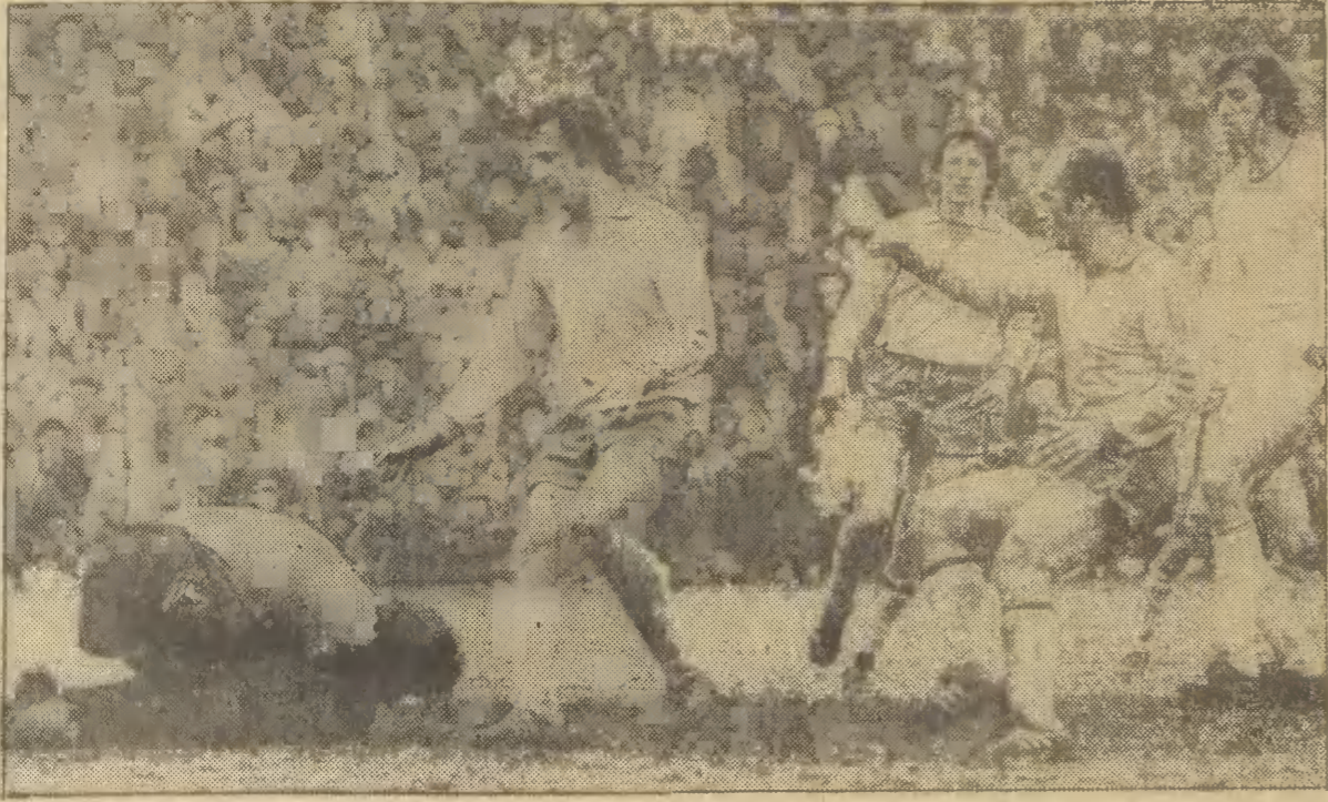
Bramkarze nie puścili gola...