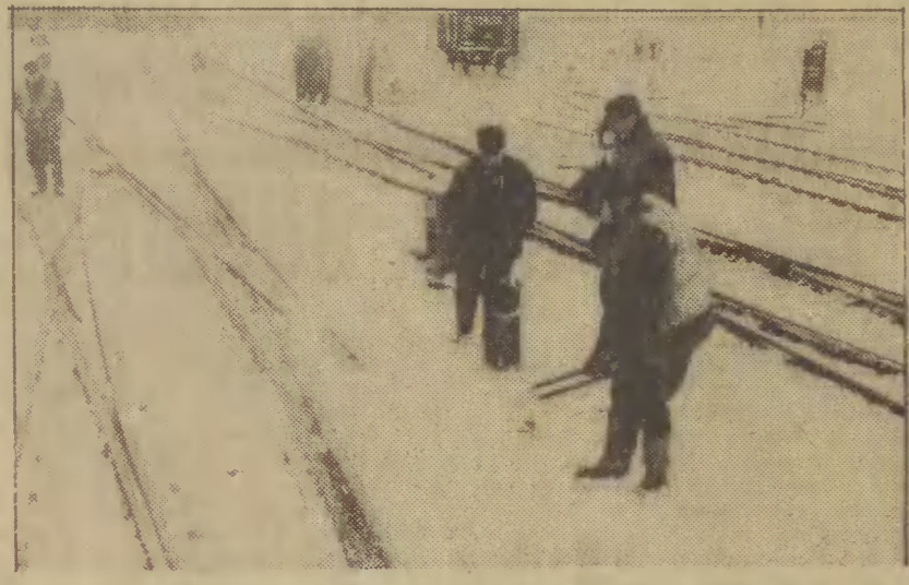
Kolejarze stacji PKP w Biłymstoku nie poddają się atakom mrozu i silnego wiatru — pracują rytmicznie i wydajnie. M. in. znacznie skrótili oni przebieg jazdy wagonów.

Dziś, o godzinie 10.00 rozpoczęło się w Warszawie VI plenarne posiedzenie Komitetu Centralnego Polskiej Zjednoczonej Partii Robotniczej. Obradom przewodniczy I sekretarz KC PZPR — Edward Gierek.