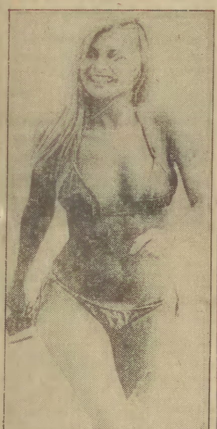
Dziewczyna z Florydy...

Robert Redford — aktor i producent filmu „Ludzie prezydenta”, przedstawiającego skandal Watergate, otrzymał te nagrody po raz drugi, natomiast Sophia Loren po raz pierwszy.