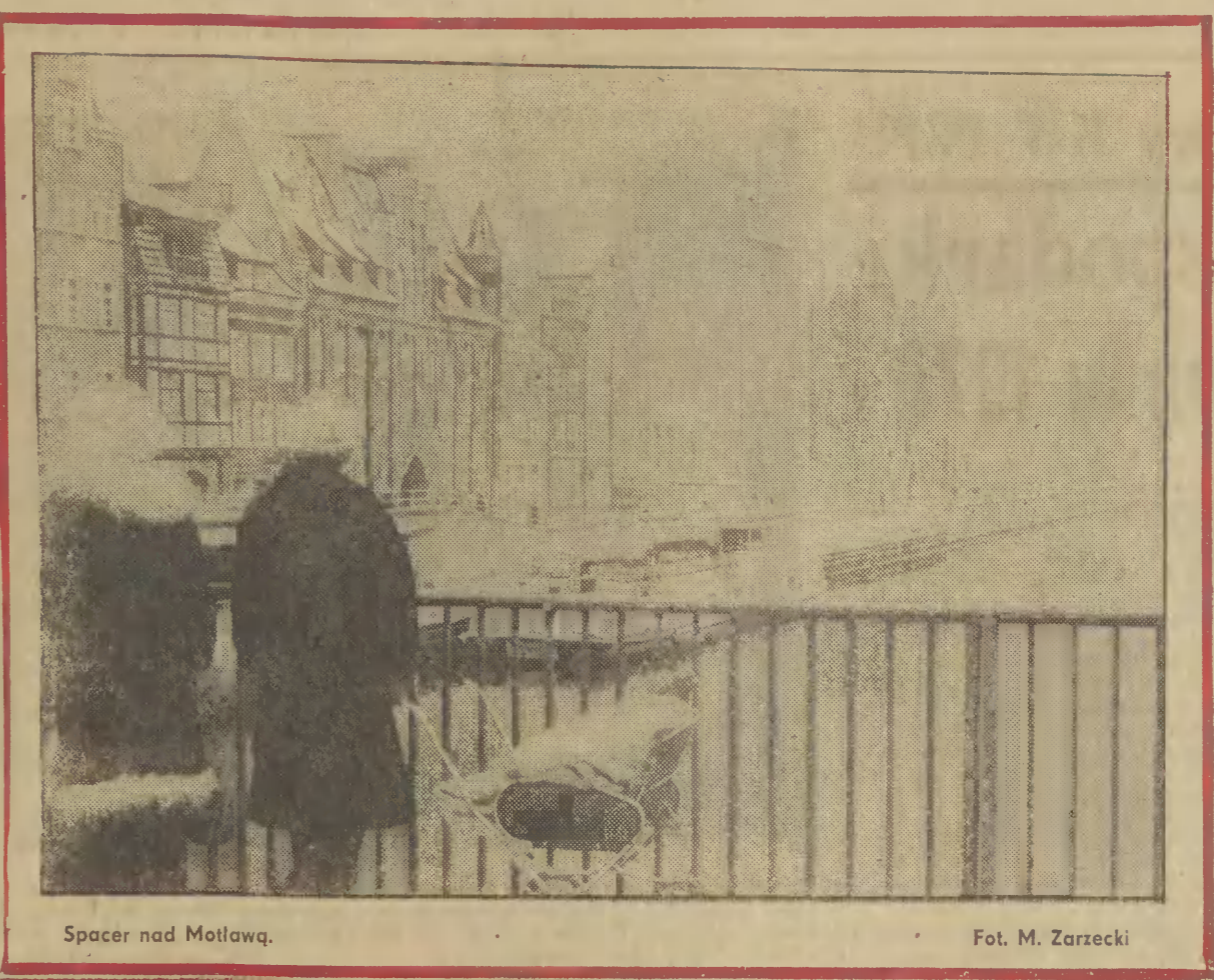
Spacer nad Motławą.

Jak informuje dyżurny synoptyk Gdynskiego Instytutu Meteorologii i Gospodarki Wodnej, jutro zachmurzenie będzie duże z możliwością opadu śniegu. Zamglenia i rano lokalnie mgły. Temperatura od minus 6 st. C do minus 2 st. C. Wiatry z kierunków zmiennych, słabe.