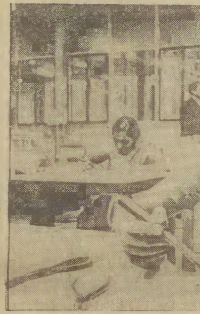
Indie. Zakłady Elektroniczne w Hyderabadze zatrudniają 5 tys. pracowników. Jest to największy obiekt przemysłu elektronicznego; współpracuje on ściśle z krajami RWPG.

sobą na arenie międzynarodowej”. „Hindustan Times” stwierdza, że stosunki indyjsko-polskie rozwi-