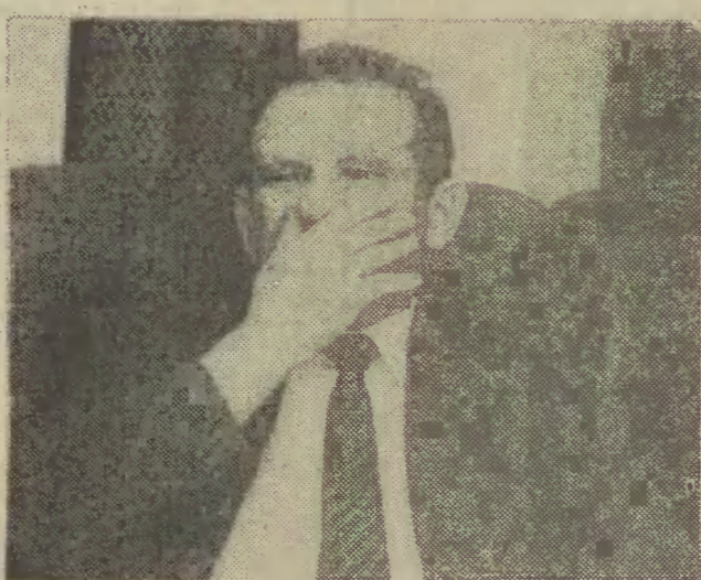
Jak to zrobić...

Prezydent Lech Wałęsa, zwrócił się do Unii Demokratycznej o przedstawienie propozycji trzech kandydatów na stanowisko premiera.