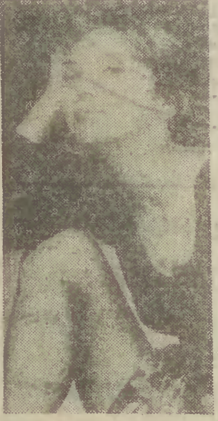
bezlitosna inkwizycja feministyczna. Czarna konserwatysta Clarence Thomas...