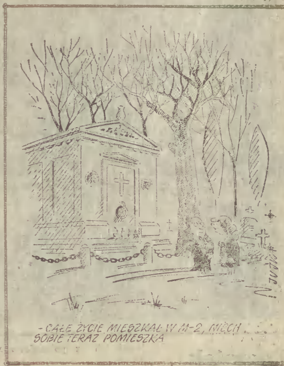
CALE ŻYCIE MIEŻKAŁ W 11-2, MIECH SOBIE TERAZ POMIĘSKA