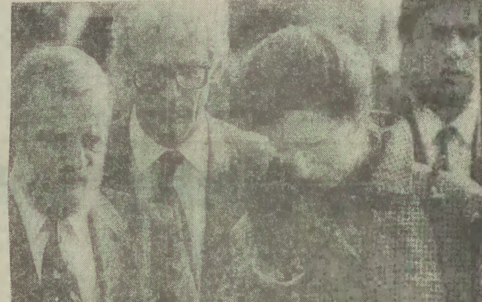
Przed pomnikiem Poległych Stoczniovców