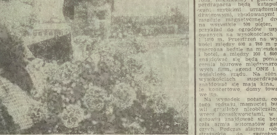
Pożegnanie na lotnisku

W czasie pobytu księżniczki Anny w Stoczni Gdańskiej, na jej cześć wymalowano krawężniki (farba była