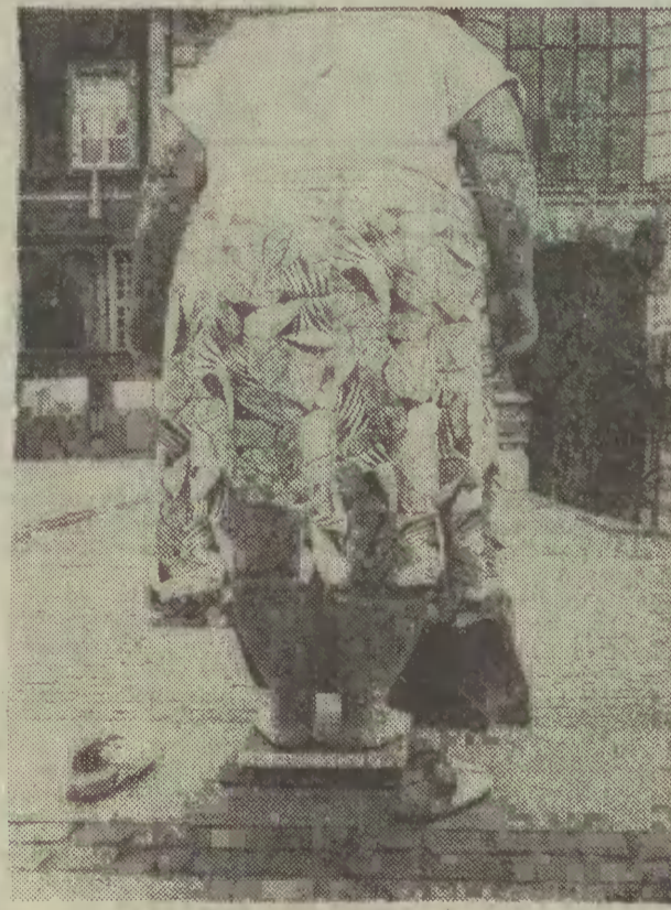
Bez głowy jeszcze mniej...

ny jest codziennie w godz. 9-19, a więc również w soboty i niedziele. Nabyć tu można cebulki pięknych tulipanów zwanych papuzimi (stropionych, lilioskształtnych), ceną odmiennie tulipana późniejszego, zwanego popularnie wesołą wdówką. Kwitnie