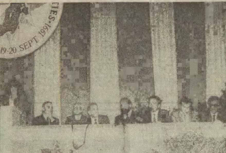
Świeżo wybrane władze Związku Miast Bałtyckich oraz reprezentanci samorządu gdańskiego w czasie wczorajszej konferencji prasowej.

Kulminacyjnym momentem 2-dniowej konferencji Miast Bałtyckich, jaka zakończyła się wczoraj w Gdańsku było złożenie podpisów pod statutem Związku Miast Bałtyckich.