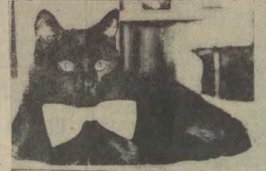
Przystojny brunet, domator bez natógów oczekuje propozycji...