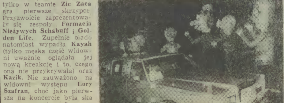
Sensacje wzbudzały kukły gości z Nicei