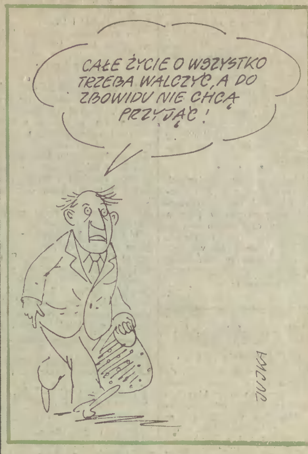
Minisonda pod Sobieskim Opanować strumień dolarów