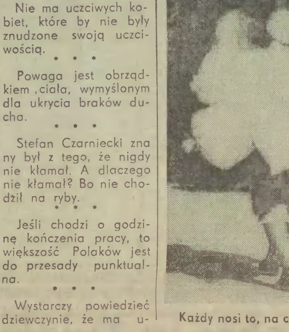
Każdy nosi to, na co ma ochotę...

Dlaczego Czerwonny Brat tak nagle zbladł? KR.