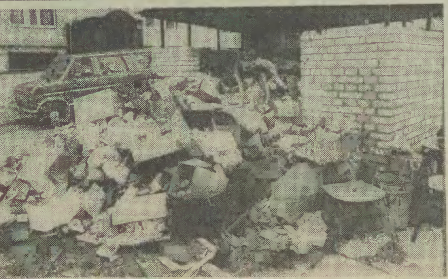
To się nazywa na swoich śmieciach