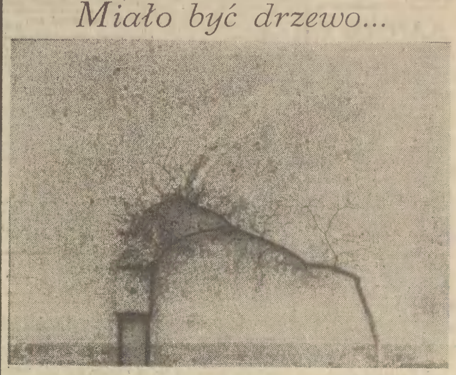
Miało być drzewo...