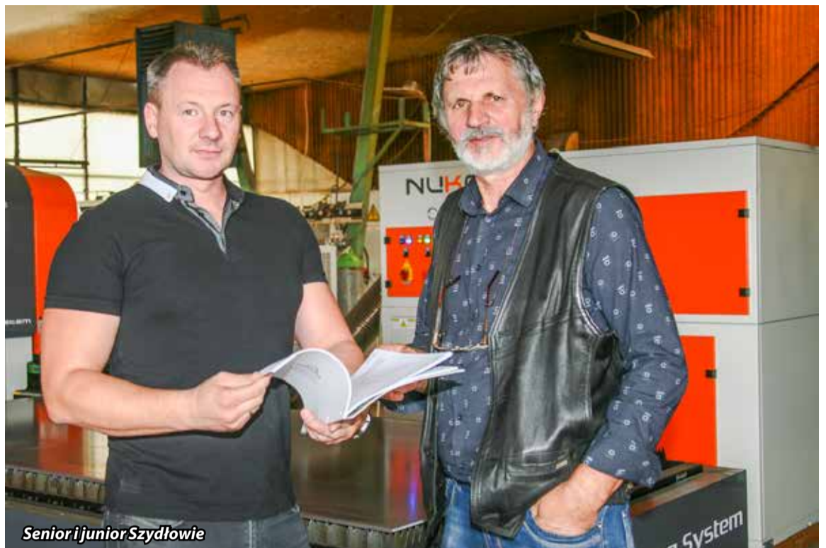
Senior i junior Szydłowie

w pełni atestowaną firmą, posiadającą spawalnicze certyfikaty, gwarantuje pełen zakres wykonawstwa konstrukcji stalowych ciężkich, średnich i lekkich, wykonując je kompleksowo wraz zabezpieczeniem przed korozją. Dzięki długoletniemu doświadczeniu i potencjałowi, jaki posiada przedsiębiorstwo, zajmuje się także produkcją i montażem