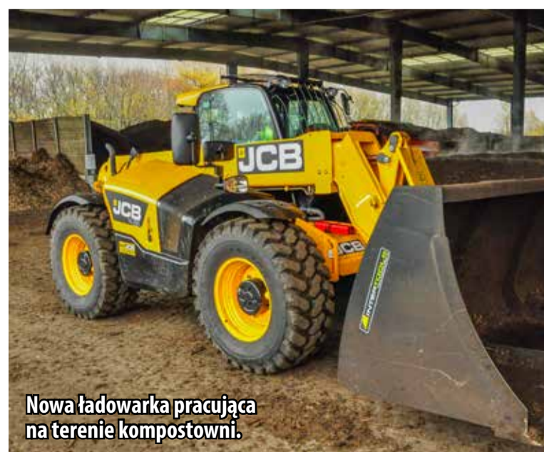
Nowa ładowarka pracująca na terenie kompostowni.