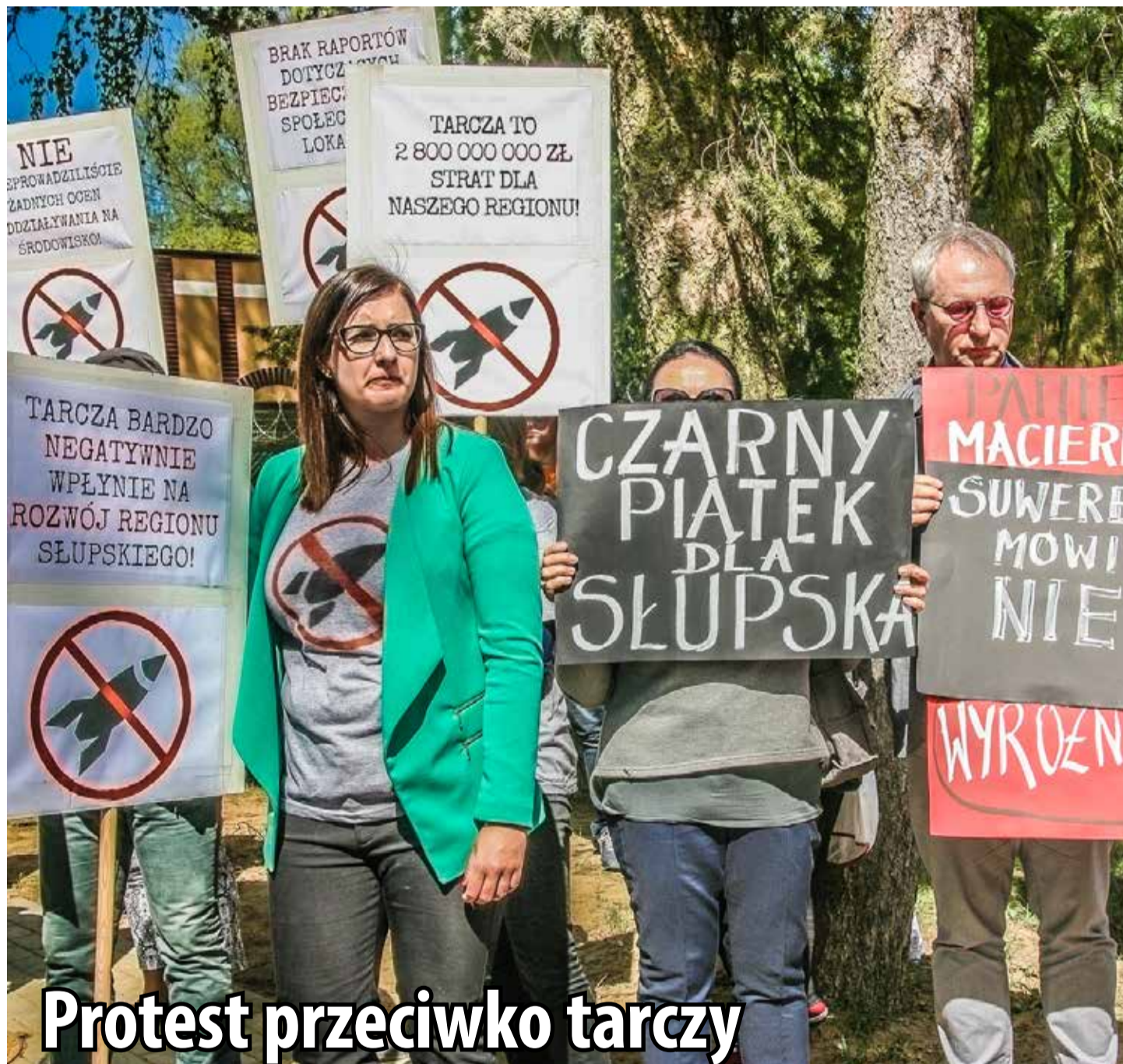
Protest przeciwko tarczy