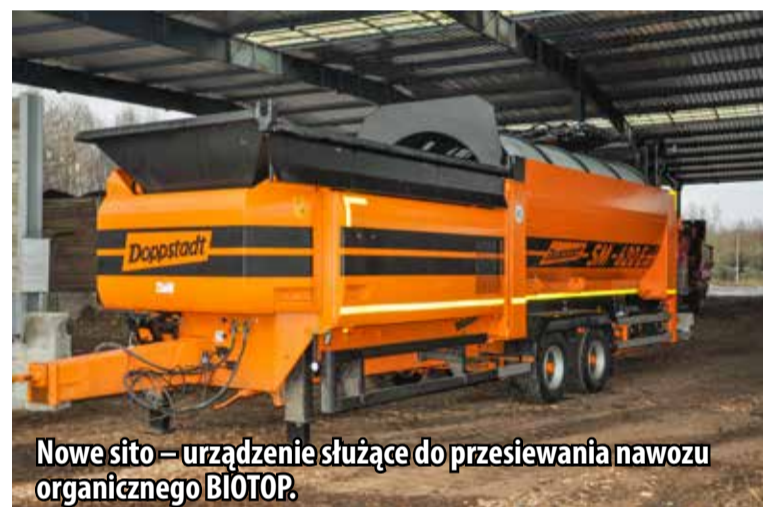
Nowe sito – urządzenie służące do przesiewania nawozu organicznego BIOTOP.

1. Rozbudowa Oczyszczalni Ścieków w części osadowej wraz z częściową zabudową wiaty kompostowni (m.in. zrealizowano rozbudowę węzła fermentacji i kogeneracji obejmującą: budowę czwartej zamkniętej komory fermentacyjnej, budowę zbiornika biogazu, budowę reaktora biologicznego dla odcieków, przebudowę obiektów i instalacji