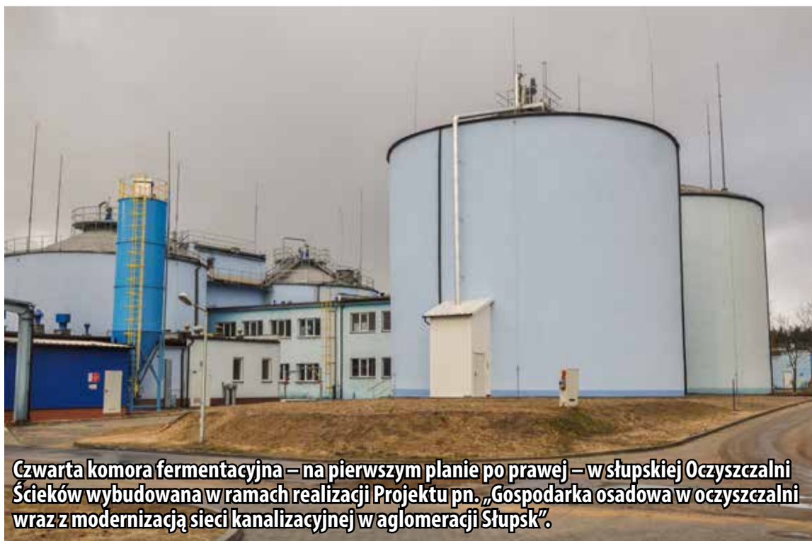
Czwarta komora fermentacyjna – na pierwszym planie po prawej – w słupskiej Oczyszczalni Ścieków wybudowana w ramach realizacji Projektu pn. „Gospodarka osadowa w oczyszczalni wraz z modernizacją sieci kanalizacyjnej w aglomeracji Słupsk”.