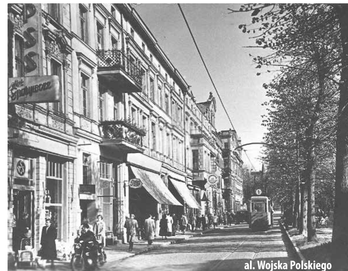
al. Wojska Polskiego

- to Słupsk zostały zmiecione z powierzchni Ziemi bombami dziesiątków lub setek sowieckich samolotów i ogniem setek, a może i tysięcy sowieckich dział. Oddziały niemieckie wycofały się ze Słupska zawczasu - wśród nich był m. in. sławny 5 Pułk Huzarów im. G. L. Blüchera (po którym pozostały wcale okazałe koszary