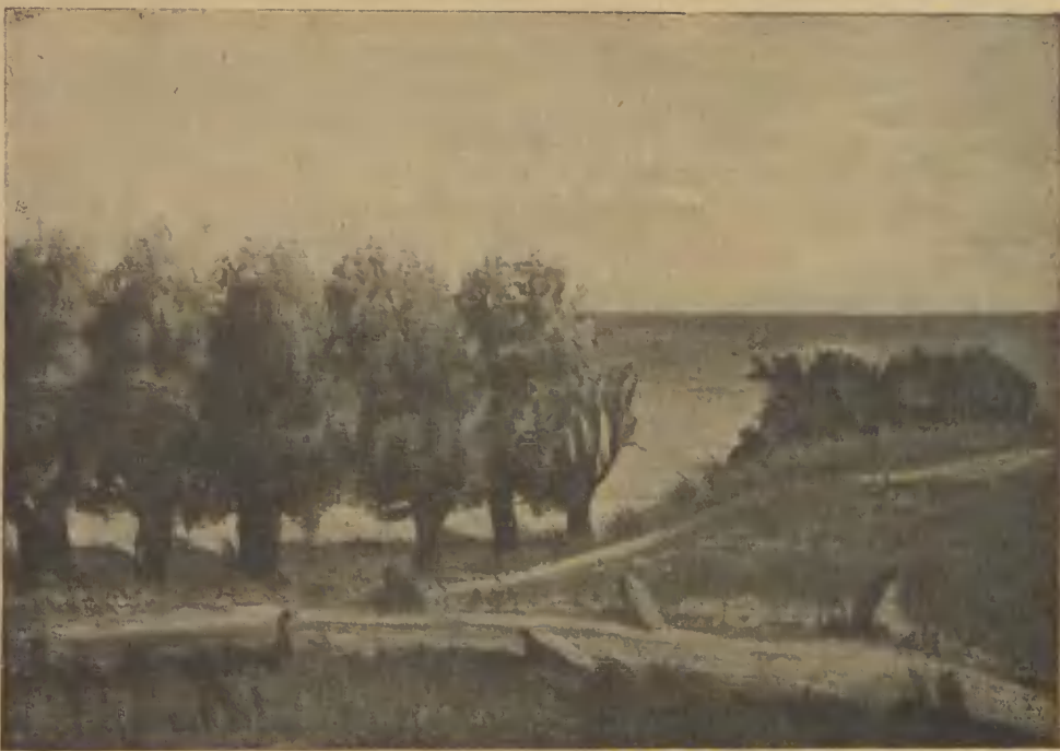
Na wybrzeżu. Wierzby na polskim wybrzeżu Bałtyku w Orłowie. — Willow trees near the sea shore in Orłowo. — M. Grodzicka-Styczyńska pinxit.

trzy lata na wędrowce spędzić musieli, w najróżniejszych, częściach kraju nauczyli się rozmaitych pieśni i przynieśli je ze sobą. Pieśni rozpowszechniali także wędrujący rzemieślnicy, chodzący za robotą. Skoro jaka pieśń choć tylko jednej osobie we wiosce była znana, nauczyła jej się wnet cała młodzież wiejska. Za czasów uprawy lnu schodziły się dziewczyny w obszernej izbie jakiegoś gospodarza i wspólnie