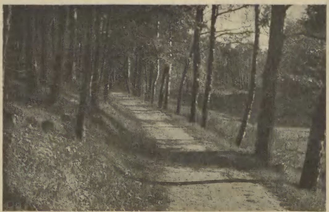
Urocze piękno tak zwanej Dolinki Redłowskiej, leżącej pomiędzy Gdynią a Orłowem Morskim.