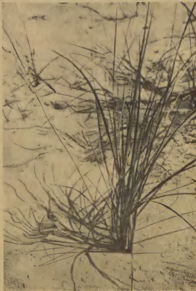
Trawa, która unieruchamia wydmy piaszczyste na wybrzeżu.

Grass which prevents the sand to be carried by wind.