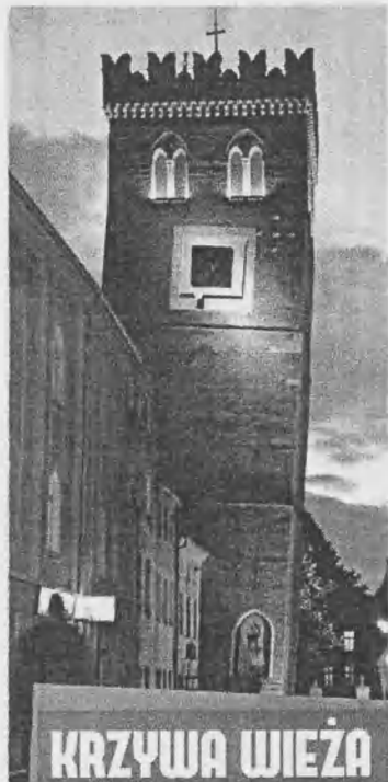
Il. 3. Krzywa wieża w Zabkowicach Śląskich – ulotka reklamowa

Dużą część czasu poświęcona została na zwiedzanie pięknej okolicy oraz poznanie historii Kotliny Kłodzkiej. „Spacer” rozpoczął się od wyjazdu do