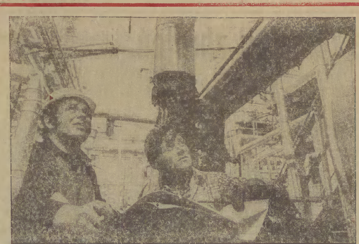
Wczoraj w Grzybowie (woj. tarnobrzezkie) przekazano do eksploatacji wytwórnię dwusiarczku węgla.