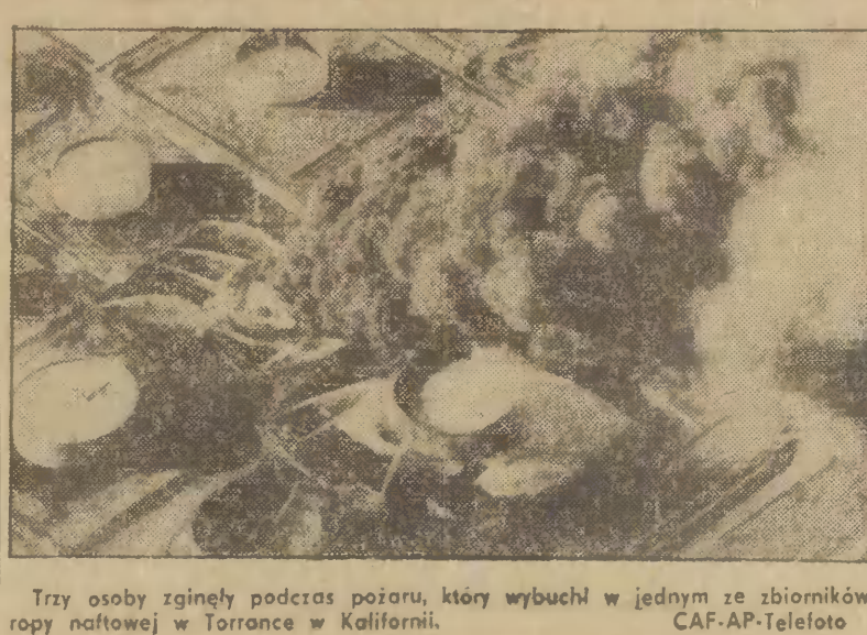
Trzy osoby zginęły podczas pożaru, który wybuchł w jednym ze zbiorników ropy naftowej w Torrance w Kalifornii.