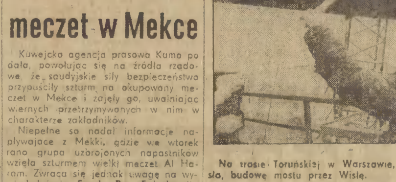
Na trasie Toruńskiej; w Warszawie, rozpoczęto ustawianie pierwszego przęsła, budowę mostu przez Wisłę. CAF-Broniarek