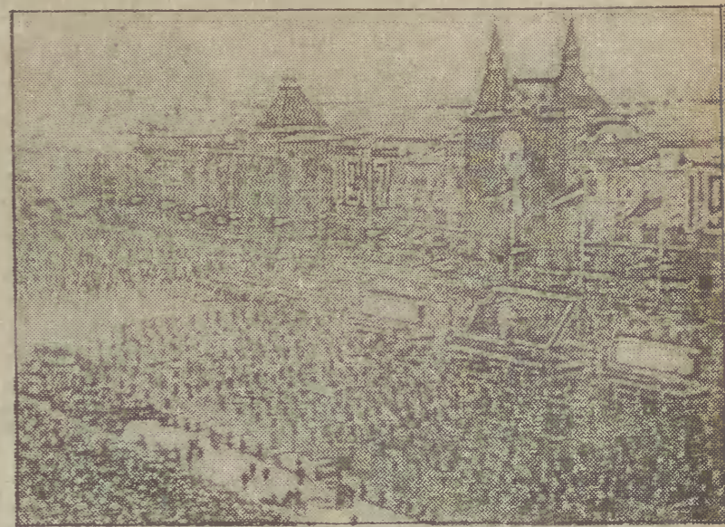
Fragment dzisiejszej wielkiej manifestacji ludności na Placu Czerwonym w Moskwie.