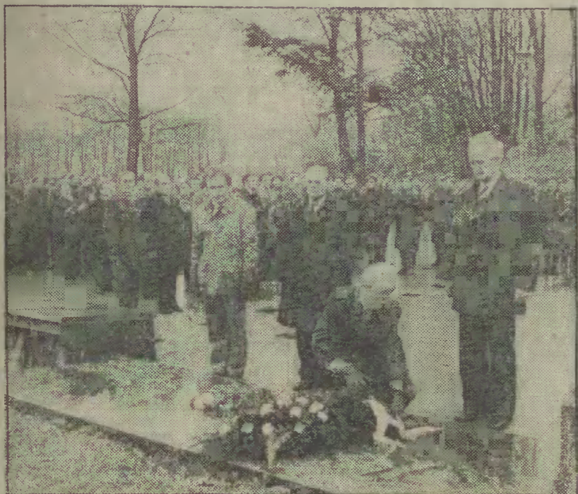
Uroczystość złożenia wieńców na Cmentarzu - Mauzoleum Żołnierzy Radzieckich.

♦ Kwiaty na Cmentarzu - Mauzoleum w Gdańsku ♦ Wojewódzka akademia w Elblągu ♦ Imprezy kulturalne na Wybrzeżu