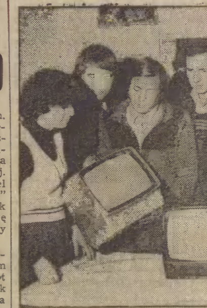
Zespół konstruktorów nowego odbiornika telewizyjnego „Neptun 150”.