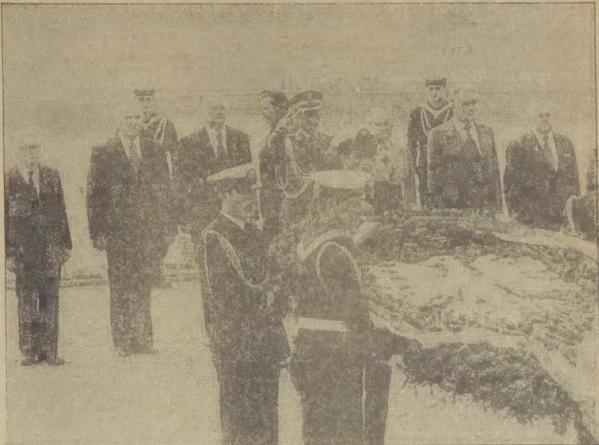
Uroczystość składania na Westerplatte wienca od narodu polskiego.