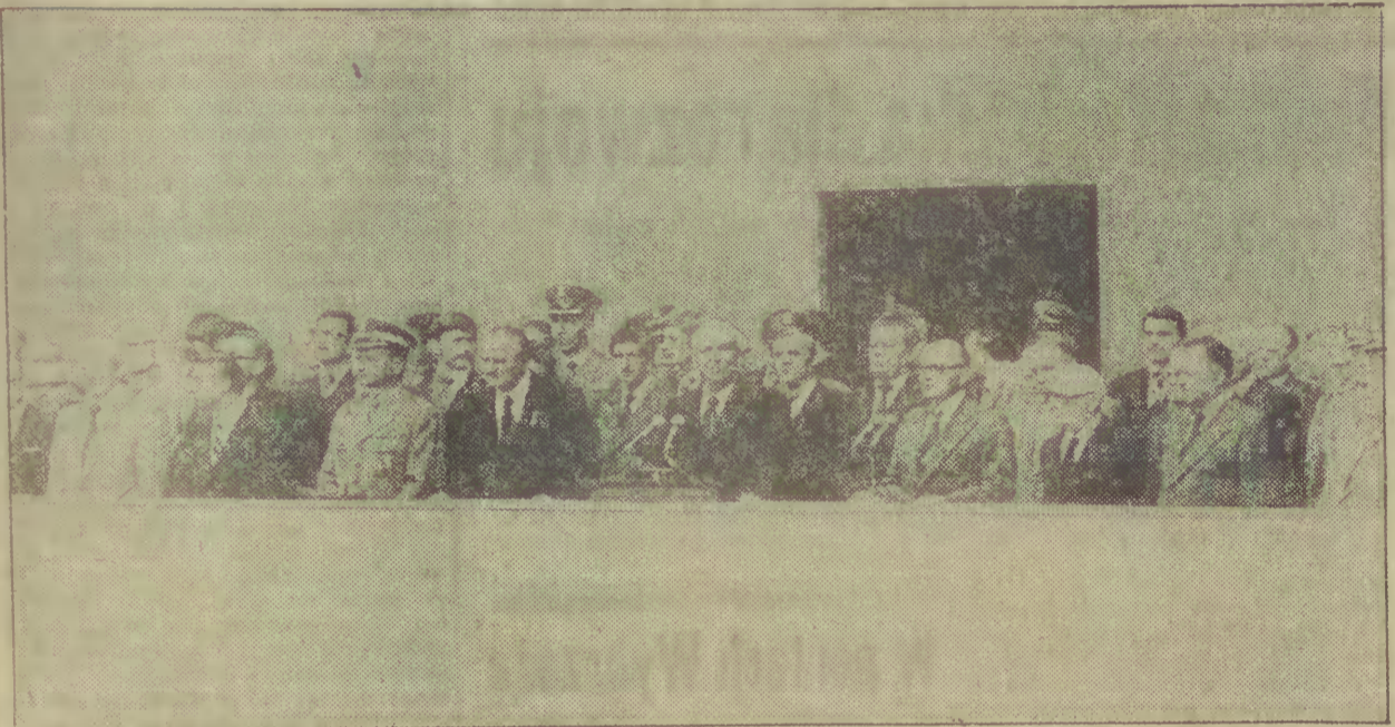
Przywódcy partii i państwa na trybunie podczas pokojowej manifestacji na Długim Targu.

P RZED południem odbyła się uroczystość odsłonięcia Pomnika Obrońców Poczty Polskiej. Rełacje z przebiegu tej uroczystości zamieściliśmy w sobotę. Następnie przywódcy partii i państwa udali się na Westerplatte, aby oddać hołd obrońcom i wyzwolicielom Wybrzeża. Rozlega się dźwięk syren. Słychać je nie tylko tutaj, w miejscu, gdzie rozpoczęły się krwawe zmagania II wojny światowej. Hołd bohaterom