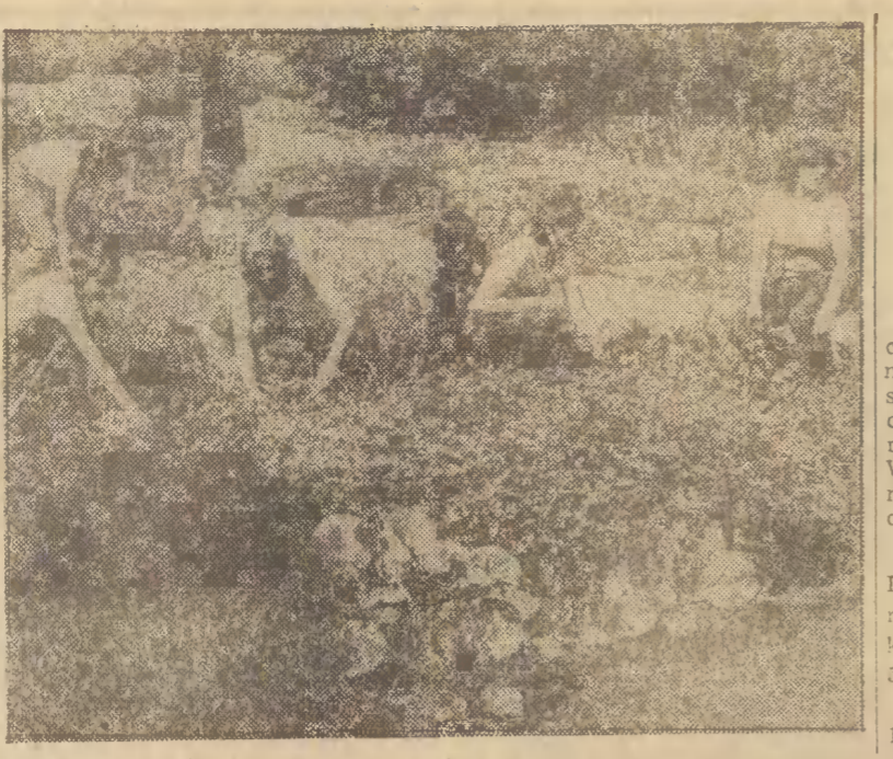
Junacy podczas pracy w parku oliwskim