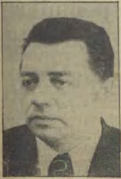
Nowy minister energetyki i energii atomowej Zbigniew Bartosiewicz.

Zbigniew Bartosiewicz urodził się w 1932 r. w Częstochowie w rodzinie rolniczej.