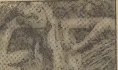
Z węgierskiej kolekcji Inu. CAF - MTI