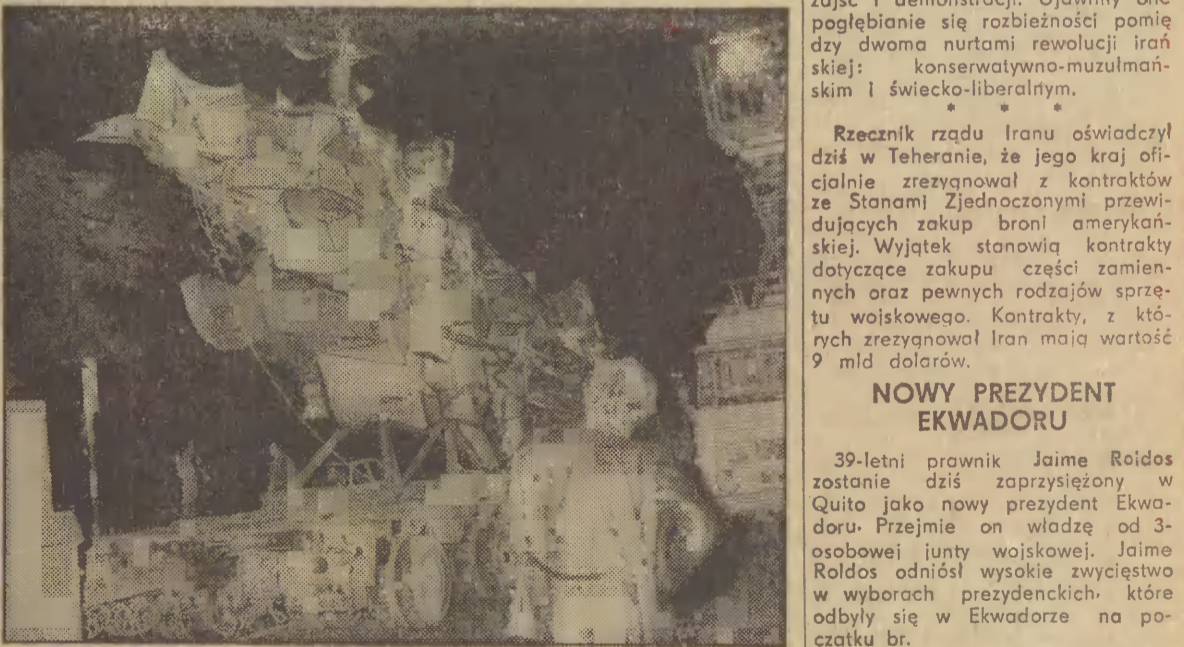
Transport pomnika ulicami Gdańska.

Autor „Spirali“, Krzysztof Zanussi, został uznany za najlepszego reżysera XVII. Międzynarodowego Festiwalu Filmowego w Panamie. Oprócz nagrody dla reżysera jury przyznało twórcom „Spirali“ nagrody za najlepszy scenariusz i najlepsze zdjęcia.