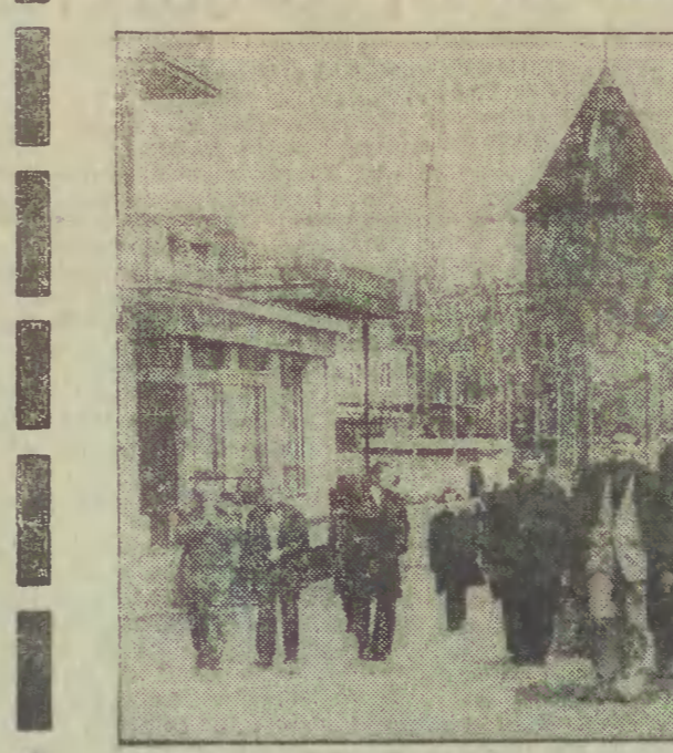
Spacer Długim Pobrzeżem.