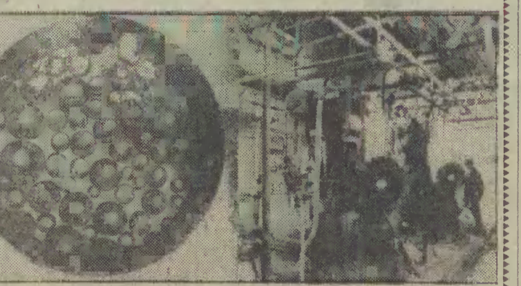
Na zdjęciu: z lewej kropki wofatyty o średnicy od 0,3 do 1,5 mikrometra, z prawej wydział polimeryzacji kombinatu Bitterfeld.

Kombinat Chemiczny Bitterfeld w okręgu Halle wytwarza wofatyty - jony na bazie żywic syntetycznych, które spełniają kapitalną rolę w procesie oczyszczania wody. Zależnie od zastosowanej kompozycji tej wymiennicy jonowe mogą usuwać z wody sole, żelazo, odbierać ją i neutralizować inne zanieczyszczenia. Dzięki zastosowaniu wofatyty można uzyskać wodę o stopniu czystości 99,99999 proc.