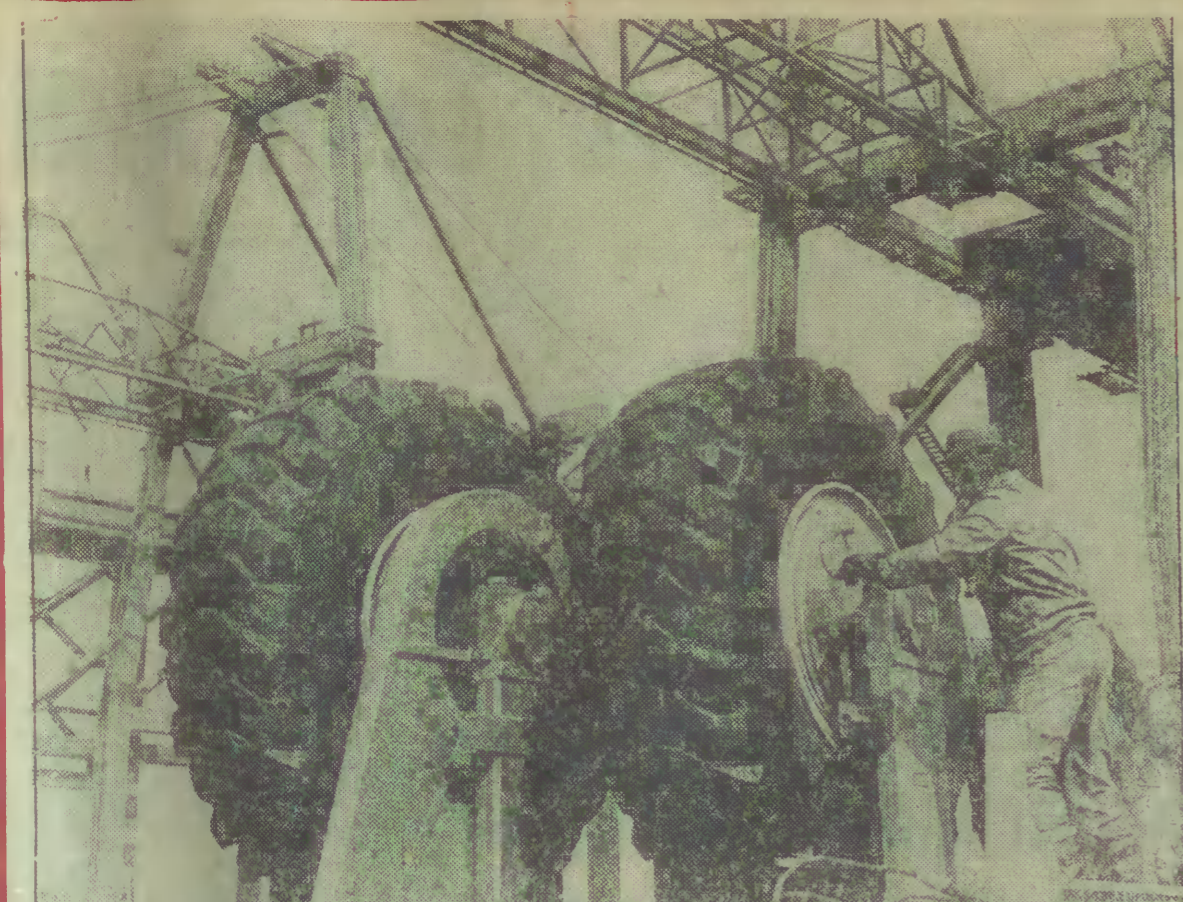
Montaż konstrukcji stalowych z Mostostalu Gdańsk Henryk Komorniczak przygotowuje jedną z podstaw suwnicy samojezdnych na kołach gumowych o średnicy 1,5 m do przeniesienia na plac kontenerowy budowanego obecnie terminalu przy nabrzeżu Helkim w Gdyni.