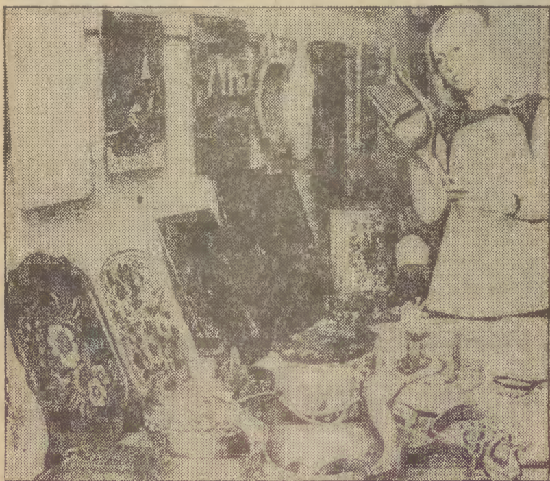
Pamiątki z Karelii, pięknie rzeźbione i malowane tace, deseczki i pudełka poszukiwane są przez turystów odwiedzających Związek Radziecki.