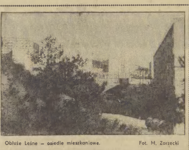
Obłuze Leśne — osiedle mieszkaniowe.